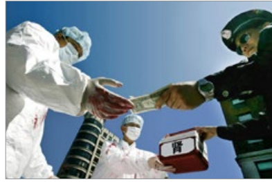
海外呼吁制止中共活体摘取法轮功学员器官