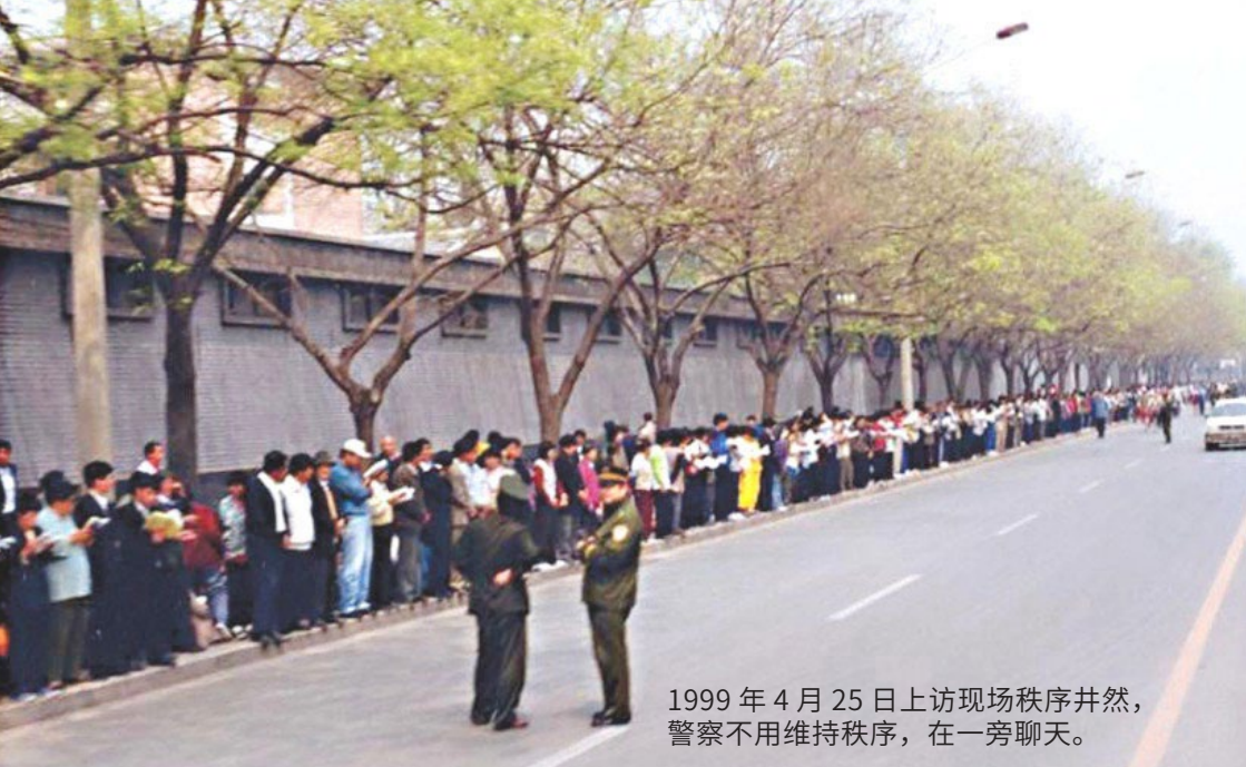
1999年4月25日上访现场秩序井然，警察不用维持秩序，在一旁聊天。