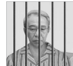
徐才厚，江泽民在军队迫害法轮功的急先锋，未审先死。