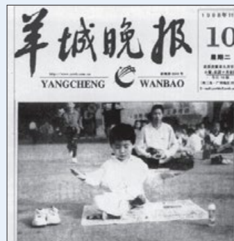
江泽民发动迫害之前，大陆媒体正面报道法轮功。羊城晚报：老少皆炼法轮功（1998年）

看遍法轮功的书籍，没有一句不让人吃药的话。江泽民为何要销毁法轮功书籍？就是怕其谎言被揭穿。