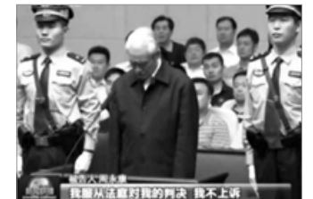
周永康，原中共政法委书记，迫害法轮功的元凶之一，被判无期徒刑。