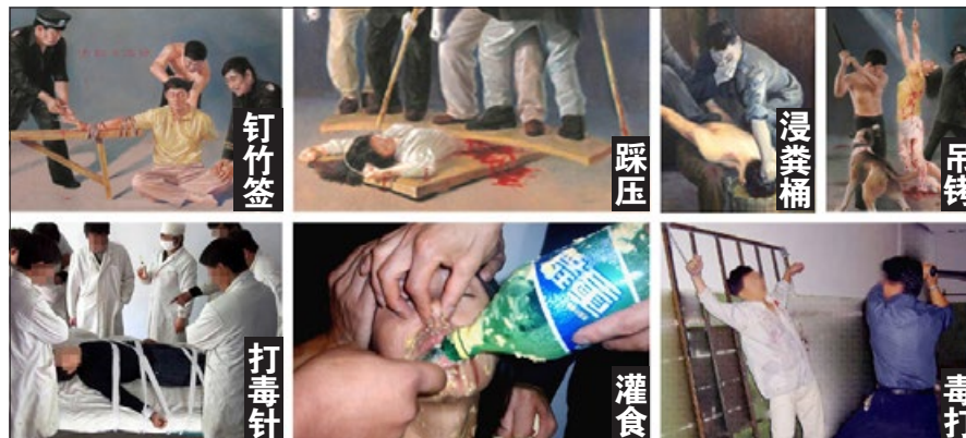
中共酷刑图示。法轮功学员遭非法监禁、酷刑折磨，被逼迫放弃信仰。已有4000多名能核实姓名的法轮功学员被迫害致死。