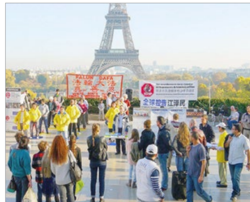
法国巴黎，游客在了解法轮功真相。

人们在加入中共的党团队时，都得表态：把一生奉献给它。这好比发毒誓，把自己的一生卖给共产党了。中共是由党、团、队员组成的，法轮功修炼者告诉人“三退”（退党、退团、退队），是希望善良人废除毒誓，天灭中共时，不给共产党作垫背、遭厄运。他们关心的是人的生命安危，无关政治。