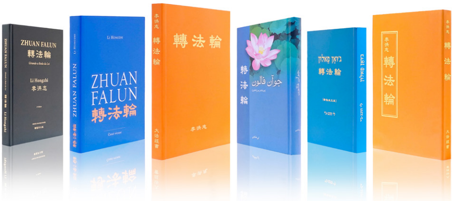
《转法轮》被翻译成50种语言在世界各地出版发行

他说：“这次全家死里逃生之后，我对法轮大法有了全新的认识，这一次我是真真切切感受到了法轮大法救了我们全家，这使我对大法坚信不疑，直到现在也在坚持每天炼功和阅读《转法轮》。也希望更多的人能知道‘法轮大法好，真善忍好’，危难时刻能得到大法的救度。”