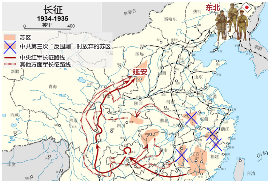
图 1.1 从红军长征路线和东北日军所在位置可以看出“北上抗日”只不过是逃跑的幌子