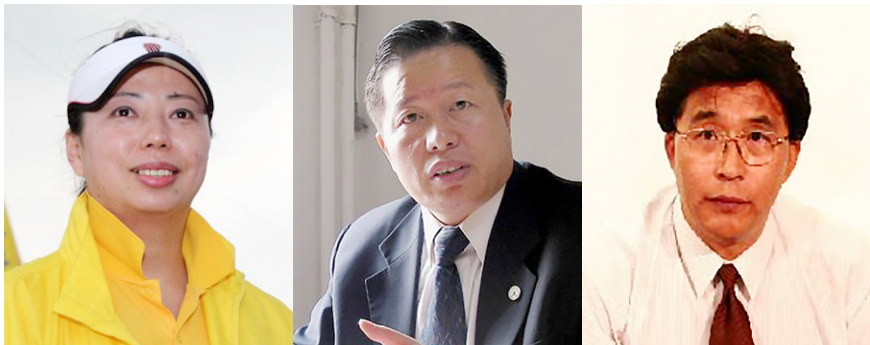
图 6.5 从左至右：黄晓敏、高智晟、韩广生

2、“中国十大杰出律师”高智晟发表公开退党声明：“它，中国共产党！它把以最野蛮、最为不道德非法手段折磨我们的母亲、折磨我们的妻儿、折磨我们的兄弟姐妹，当成了它党员的工作任务，提高到它的政治高度，它在一刻不停地逼迫煎熬着我们人民的良