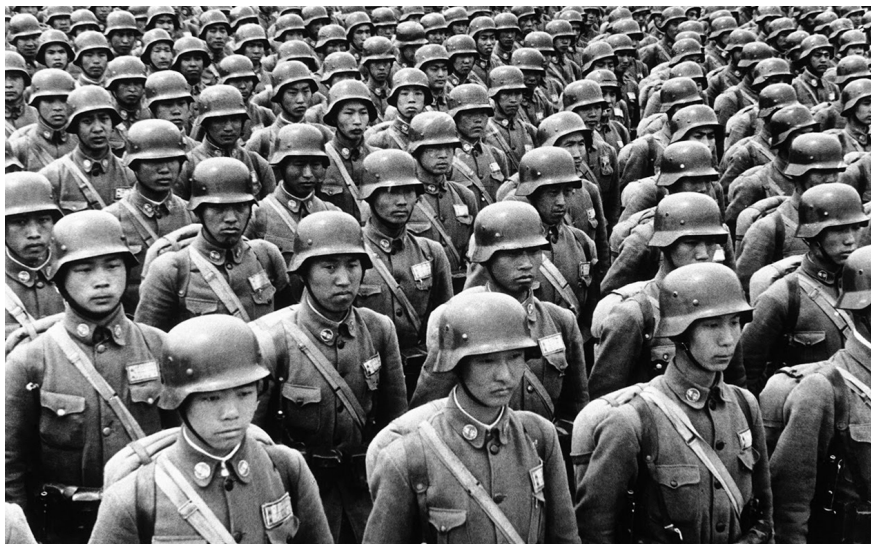
图1.2 1937年，参加淞沪会战的精锐国军——德械师，3万精兵在抗战一开始就壮烈牺牲