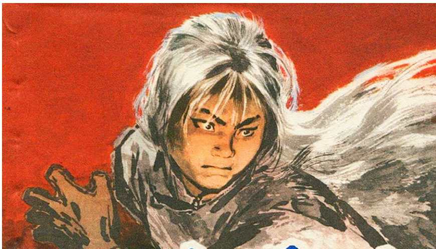
图2.1 《白毛女》连环画。中共借《白毛女》成功煽起了群众对“旧社会”的仇恨

传说在河北平山县的一个山洞里，住着一个长满白毛的仙姑。仙姑惩恶扬善，扶正祛邪，主宰人间祸福，因此人们都前去上供。在抗战期间的晋察冀根据地，因为晚上人们常常去给仙姑进贡，所以“斗争大会”开不起来。西北战地服务团的作家邵子南为配合“斗争”需要，把村民们从仙姑庙中拉回来，于是瞎编了一个民间故事，主题是“破除迷信，发动群众”，此为《白毛女》雏形。