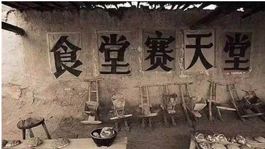
图4.4 人民公社时期的大食堂