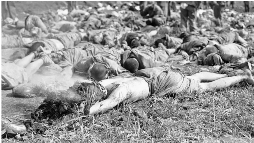
图4.3 中共的人海战术使得“志愿军”死伤无数