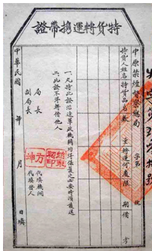
图 3.1 吸食鸦片的人 图 3.2 “解放区”中原禁烟督察总局特货（鸦片）转运携带证