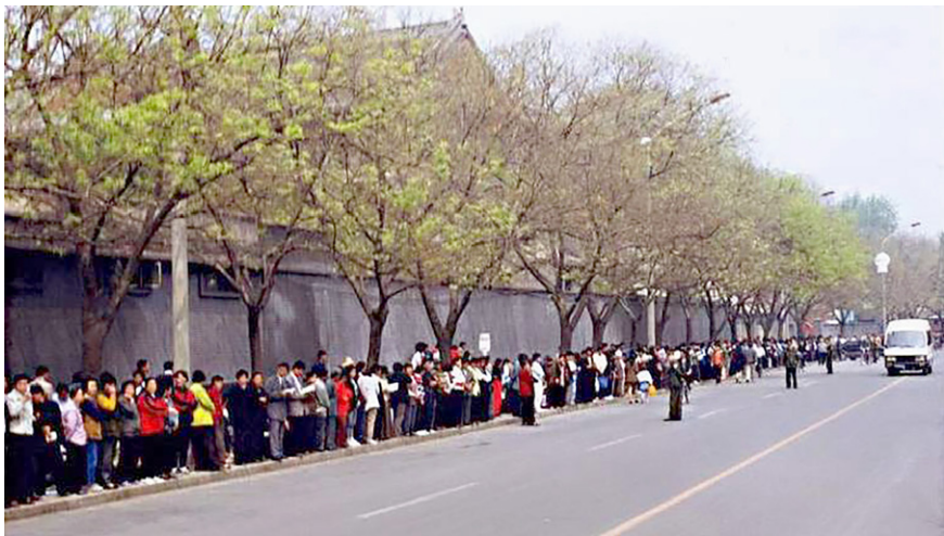
图 6.1 1999年4月25日，北京，“4·25”现场

1999年4月11日，中科院院士何祚庥在天津教育学院《青少年科技博览》杂志发表文章，污蔑法轮功致人得精神病。天津法轮功学员去编辑部澄清真相，却遭到天津市公安局防暴警察的殴打，45人被抓。4月25日，万名法轮功学员到北京中南海附近