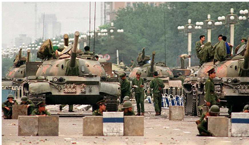
图 5.1 1989年6月4日，北京天安门广场

来到美国的第二天，我就和来接飞机的同学们争吵了起来。我跟他们打赌，天安门根本没死人；对“六·四”的造谣是西方反华势力所为；你们可别忘了自己是中国人等等。可是同学们给