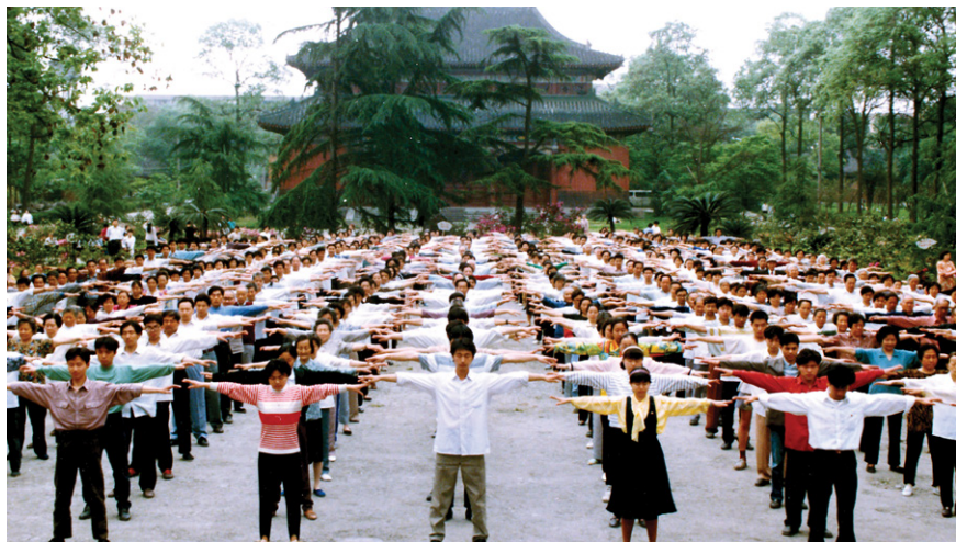
图 5.2 1999 年 7 月 20 日前，四川省成都市的部分法轮功学员在晨练

在这个普遍堕落的时代，人的内心深处仍有向善的精神渴求，我也一直在寻觅，寻觅那条让生命能升华的路。拜读法轮大法的著作，茅塞顿开，从最低层次中说，我知道了怎么做个好人，我再不会用笔去欺骗别人，我再不会明明白白干坏事，伤害别人，我有了衡量事物好坏的标准——“真、善、忍”，我内心从此拥有了平静与无私，也无忧无惧，生命充满了感恩和对他人的善。我要告诉所有的人：法轮大法好！