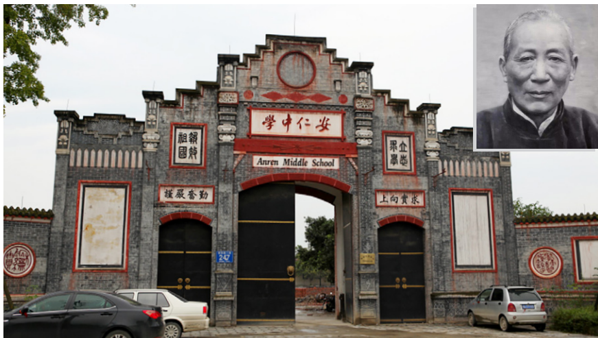
图2.2 安仁中学的前身是刘文彩建立的文彩中学。右上图为刘文彩

邑县提出“冷月英坐刘文彩家水牢”的方案,得到了主管部门认可。1958年,主管部门将刘家地下室灌上水,仿制了铁囚笼、三角钉等刑具向社会开放。冷月英也开始到处声讨刘文彩的滔天罪行。后来有记者找到冷月英,她拒绝正面回答,情急之下脱口而出:“你们追着我问什么?又不是我要那样讲的,是县委要我那样讲的。”