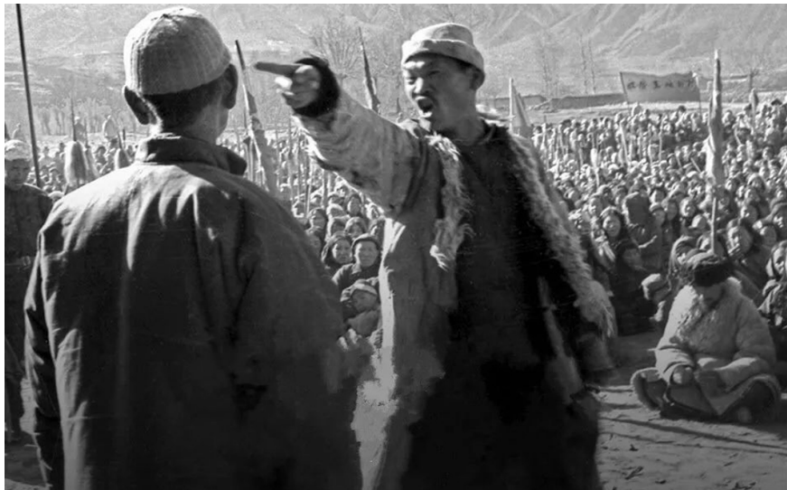
图 4.1 农村痞子在中共干部鼓动下批斗地主