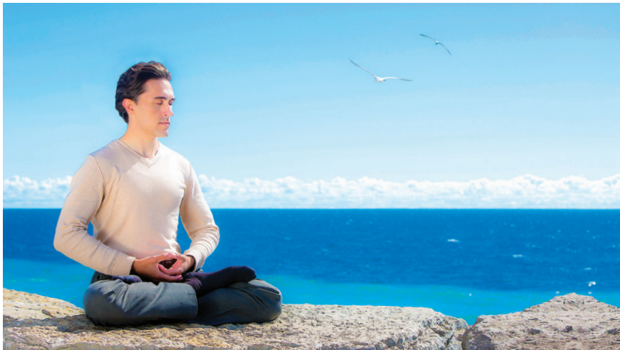
图 6.6 加拿大法轮功学员在海边炼功

1994年8月27日，李洪志先生在延边朝鲜族自治州办班，收入7,000元全部捐赠给该州红十字会。