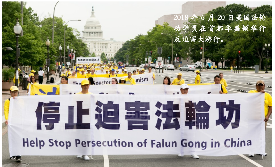
2018年6月20日美国法轮功学员在首都华盛顿举行反迫害大游行。