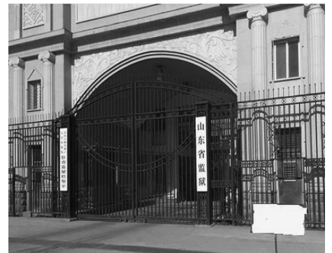
▲山东省监狱位于济南市历下区工业南路91号