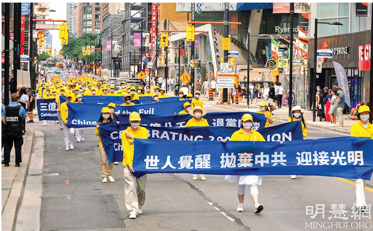
■ 8月22日，多伦多法轮功学员在市区举行了主题为“世人觉醒 抛弃中共 迎接光明”的大游行。

她用手机把整个游行队伍都记录下来，她一边录一边跟队伍里的人挥手互动：Very Good! Excellent! Thank you! (非常好! 非常棒! 谢谢!) 她还表示，回去后会把录像分享给所有人。