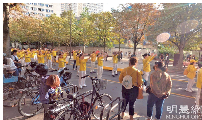
■ 上图：2021年9月11日，法轮功学员在巴黎唐人街举行盛大游行，呼吁立即停止迫害法轮功。 ■ 左下图：悼念在中国大陆被迫害离世的法轮功学员。右下图：法轮功功法演示方阵。