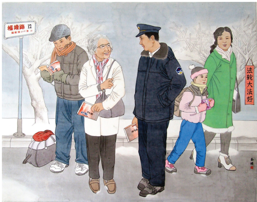
■中国大陆部分警察和法轮功学员接触后, 明白了真相, 不再参与迫害, 还暗中保护法轮功学员。

红, 把警号也露出来了, 接着他给我讲了在2000年中共疯狂迫害法轮功时, 他接触到的法轮大法弟子。