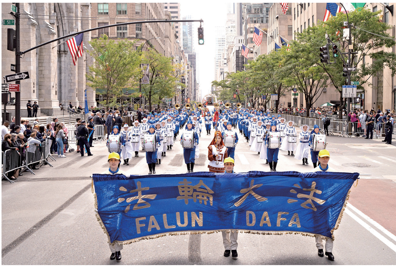
■二零二一年十月十一日，睽违两年的、一年一度的“哥伦布日”游行回到了纽约市的第五大道。法轮功学员组成的天国乐团，炼功队，腰鼓队和旗阵参加了游行，受到民众的赞誉。

游行中，众人挥舞着意大利国旗，数十辆花车和乐队、上百个团体从第五大道上的四十四街游行到七十二街。法轮功学员的天国乐团、旗阵、法轮功功法展示与腰鼓队，在游行队伍中，非常亮眼。法轮功学员的演奏，鼓乐声声都传递着真、善、忍的信息，给观众留下深刻印象。观众纷纷表示法轮功队伍独特出众，非常棒，他们很喜欢。