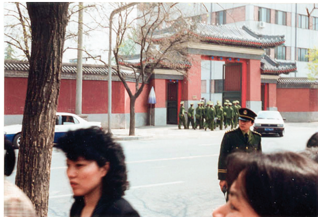
■左图：上访群众的身后，并不是中南海特有的红色围墙。法轮功学员是到位于中南海附近的国务院信访办上访。右图：中南海的红色围墙那边没有人。