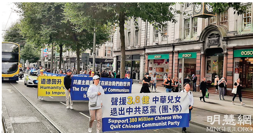
■二零二一年九月二十五日, 爱尔兰法轮功学员在首都柏林市中心举行了游行和集会, 声援3.8亿中国民众三退。

爱尔兰国会参议员大卫·诺里斯(Senator David Norris)致信主办方, 对当天的活动表示支持, 他说:“我一直反对一切形式的虐待, 无论