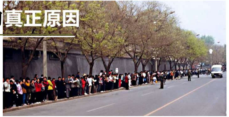
【现场图片】1999年4月25日，上万名法轮功学员到国务院信访办上访。