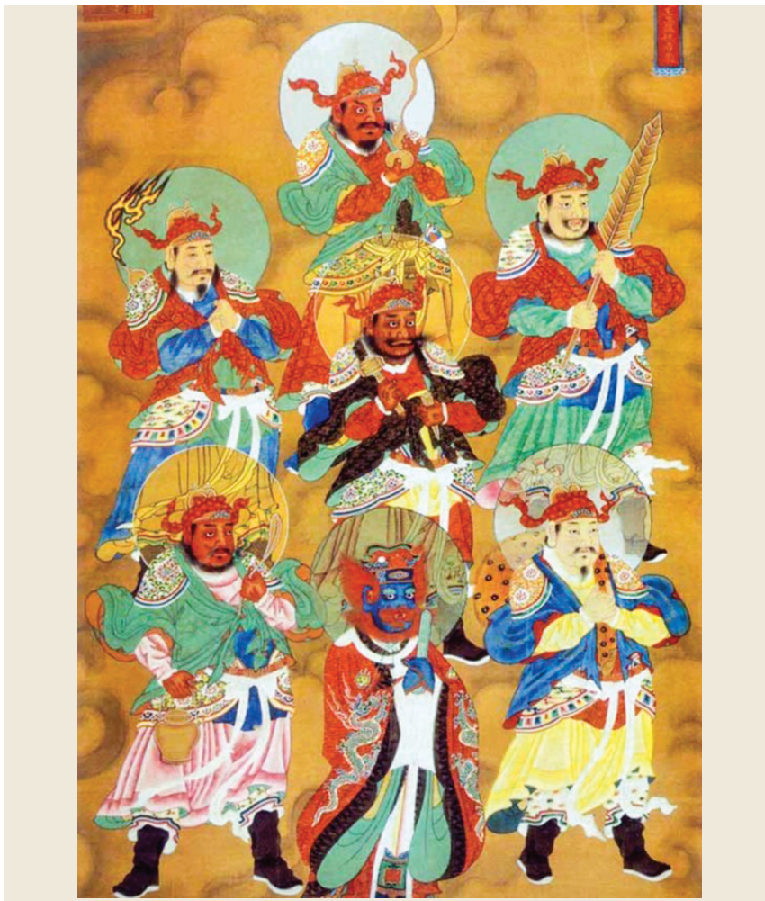
■ 明代萬曆年間的瘟神畫像，局部。（公有領域）

隋文帝急問太史公張居仁：「此為何神？主何災福？」張居仁答曰：「此為五方力士，在天為五鬼，在地為五瘟。春