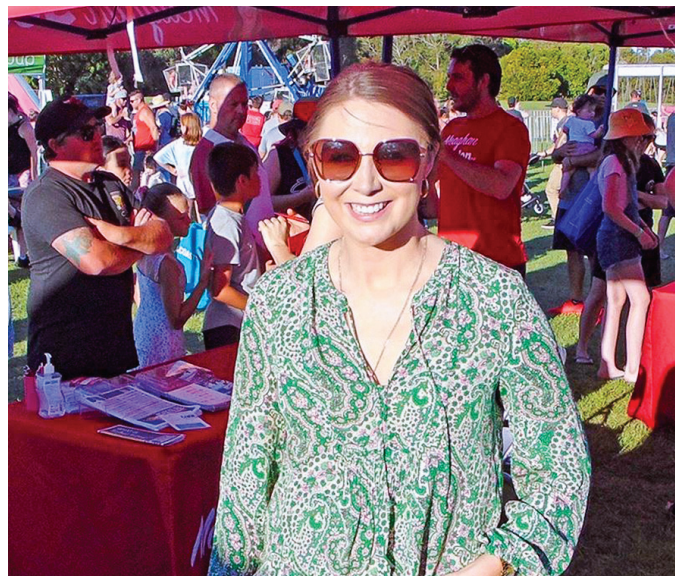
■昆士蘭環境部長、昆士蘭工黨蓋文州議員梅更·斯坎倫讚揚「真、善、忍」理念。

昆士蘭環境部長、昆士蘭工黨蓋文州議員梅更·斯坎倫（Meaghan Scanlon）曾在多個