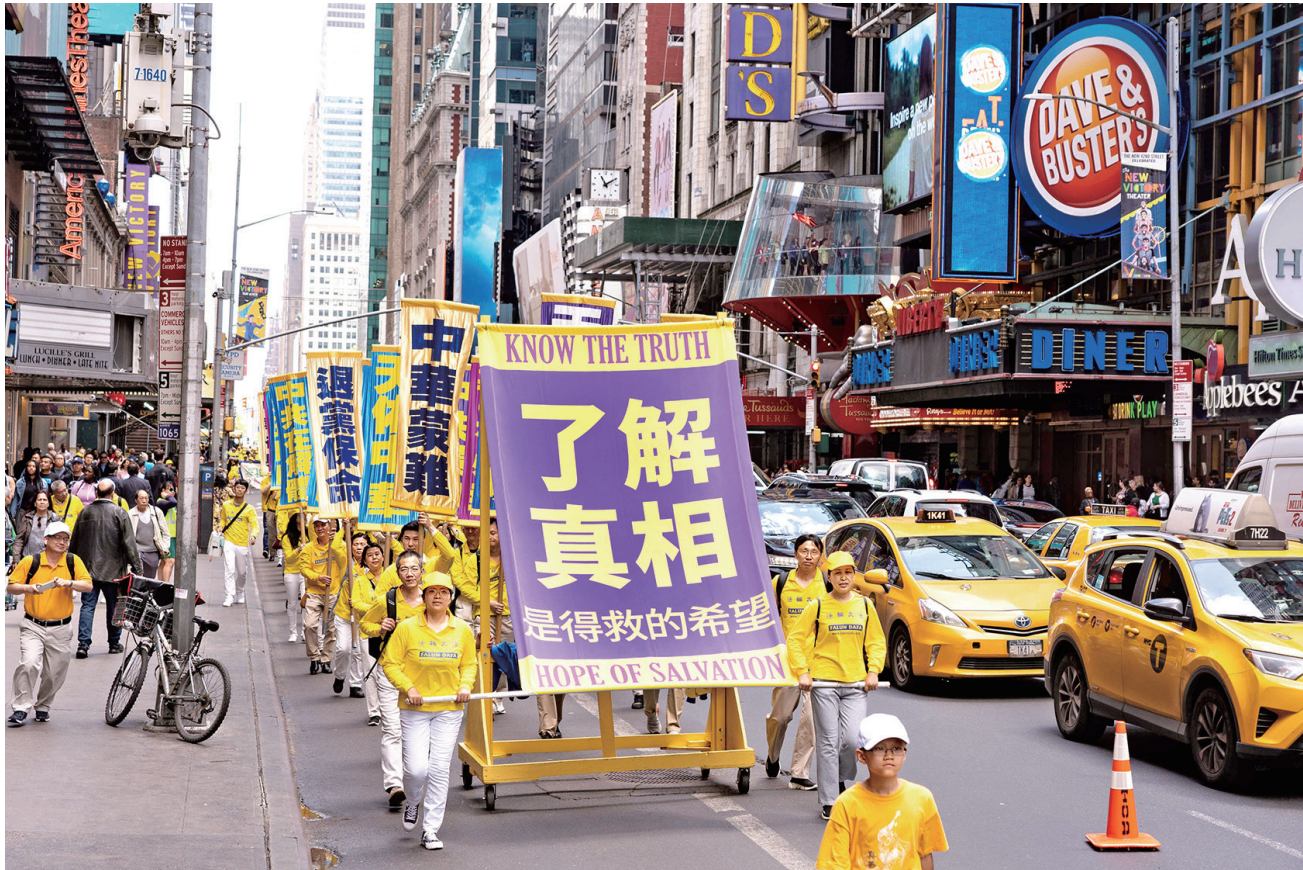
■ 2019年5月16日，來自世界各地的部分法輪功修煉者，在紐約舉行橫貫曼哈頓的盛大遊行，慶祝法輪大法洪傳27週年，聲援三億多中華兒女退出中共黨、團、隊。圖為遊行隊伍中的標語「了解真相是得救的希望」。

我接連去了他家四次與他聊天，從法輪功是什麼開始講起，中國歷史上的聖人奠基修煉文化，八十年代的氣功鋪路，如今法輪大法洪傳全球五大洲一百多個國家和地區。《轉