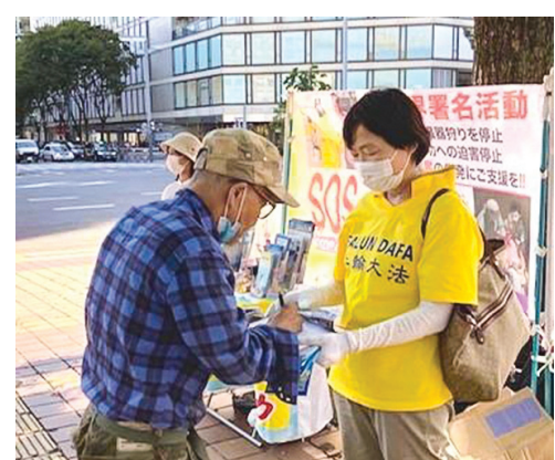
■二零二一年十月三日，在名古屋市中心，明真相的世人簽名支持法輪功反迫害。

當天也遇到了在日本生活的中國人。有一位來自大陸的女士，和法輪功學員交流了很久，收下了資料，也記住了九字真言，認同真、善、忍。她知道共產黨的邪惡，並表示今後會再來詳細地了解法輪功。