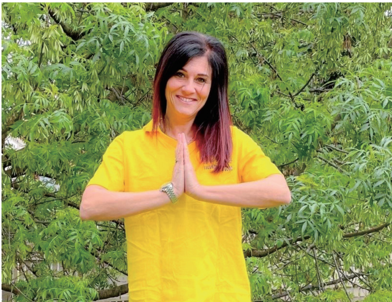
■ 勞拉對法輪大法師父表達無限的感恩。

大法修煉讓勞拉變得更平和、穩重、堅強，也更理性。她說，向內找是師尊給予學員們的法寶。「通過修煉，很明顯的改變就是，我不會再生氣了。發生任何事情的時候，也許在一開始我受到了傷害，但『向內找』總是首先冒出的念頭，而且確實是最後都能明白自己在某些方面需要提高了。」她說。