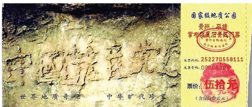
■貴州省將平塘縣藏字石景觀建成國家級地質公園，圖為公園門票，其中大石頭上天然形成「中國共產黨」六個大字歷歷可觀。

六十多年來，無數中國人被「自願」（欺騙、誘惑，或無奈）發了那個最惡毒的誓言：為自己都不相信的主義奮鬥終身，並隨時準備為之犧牲一切。細想想，發誓隨時準備為中共犧牲一切？！多麼惡毒的誓言？當然多數人並不願真的為之「犧牲一切」。反過來講，中國人自古重信義，言而有信是一個正常人的道德底線，一個連發誓都不當回事的人，當然也談不上什麼誠信、道義。