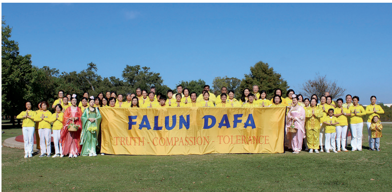
■二零二一年十一月二十日，美國休士頓法輪功學員雙手合十，恭祝法輪大法師父感恩節快樂。