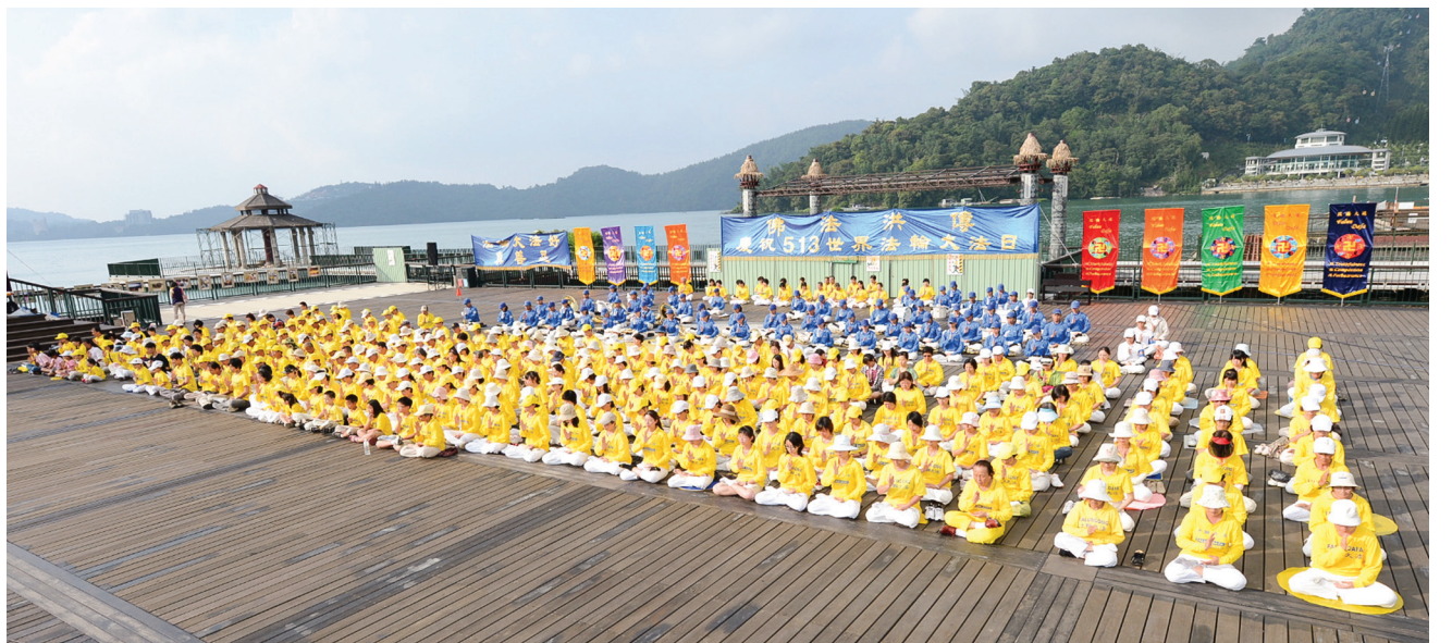
■2012年5月13日，台灣部分法輪功學員在日月潭集體煉功，慶祝世界法輪大法日。

嚴重失眠症在醫學上是一個棘手的問題。可我走入大法修煉，僅僅幾天頑症就消失了，大法真是神奇！