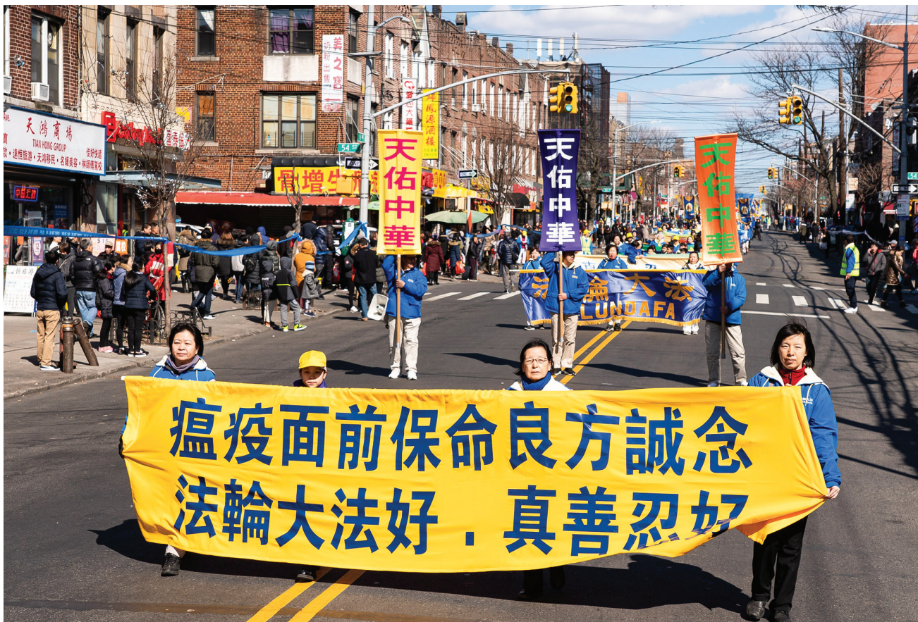
■法輪功學員向世人傳遞疫情中保命良方，誠念「法輪大法好，真善忍好」九字真言。

鬼神為什麼在金家外牆上標上記號？因為金家的媳婦（娘家姓錢），守節已經三十多年了，而守節的孝婦，從來都