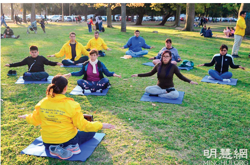
■十歲男孩 (前排左一) 和來自委內瑞拉的女士 (前排右一) 都學煉了完整的五套功法。

一個來自委內瑞拉的女孩說知道法輪大法，一直想較深入地了解。她看到學員們很高興，想立刻學功法。學員組織了幾個有興趣的人一起學功，這位委內瑞拉女孩和那個小男孩都學完了五