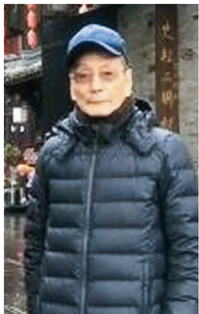
■九十歲高齡的國田老先生，因誠念九字真言，和家人一起見證了法輪大法帶來的奇蹟。

阻塞」，無藥可以醫，老先生肺功能會一天一天衰退。老先生也住過幾次院，都有驚無險緩了過來。身體基本處於比較平穩的狀態。