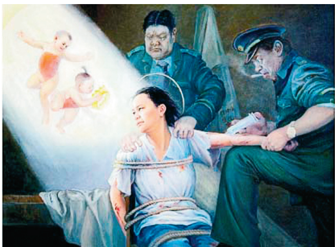
■描述中共用精神病藥物迫害法輪功學員的油畫：打毒針。