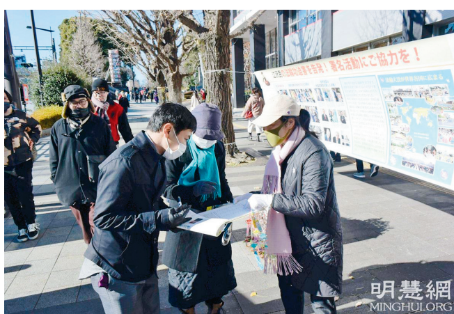
■市民簽名支持法輪功反迫害。

她們聽得很認真，最後兩位女生在學員的幫助下上世紀元退黨網站，當場辦理了三退，退出了曾經入過的團、隊組織，把三退證書號碼都拍了照，保存好。臨走時，兩人高興地收下了英文和中文的各種真相資料和一本《九評共產黨》。