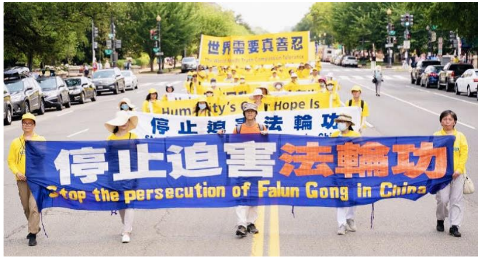
图：2021 年7 月16日，法轮功学员在华盛顿DC 大游行，谴责中共迫害。