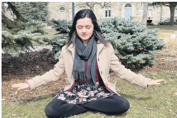
◀ 阿文达诺正在炼法轮功的第二套功法——法轮桩法(左)和第五套功法——神通加持法(右)。