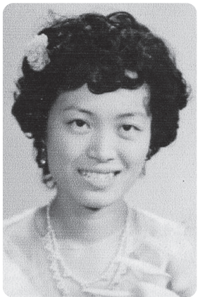
▲ 妹妹雍芳智生前照片