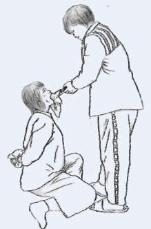
▲酷刑示意图：用鞋刷捣抹布堵法轮功学员嘴。

双腿强行一字劈开。犯人强行将法轮功学员的双腿一字劈开。两个塑料板凳不断地向身后挪，同时还用手狠命掐法轮功学员的胳膊，折磨的法轮功学员疼痛惨叫。