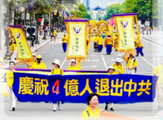
4억명 삼퇴 경축 퍼레이드