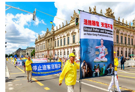
2022년 7월 15일, 전 베를린 지역에서 퍼레이드를 개최한 파룬궁 수련생들

중공은 박해 구실을 찾기 위해 '천안문 분신자살' 등 수많은 가짜 뉴스를 만들어냈다. 이는 중공의 '가짜, 사악, 투쟁(假惡斗)'의 본질을 드러냈다.