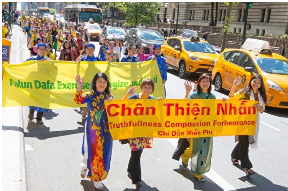
2017年5月12日，纽约上万人庆祝法轮大法弘传世界25周年，来自越南的法轮大法学员穿着传统服饰“奥黛”参加游行。

2017年8月15日，我的表姐给我打电话，让我学炼法轮功，说对我的身体有很大好处。侄子给我买了《转法轮》(法轮功主要书籍)，他还教我在网上找到了免费学炼法轮功五套功