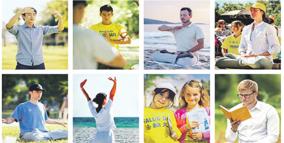
▲相较于中共的残酷迫害，法轮功却在海外迅速弘传，图为国外法轮功学员。