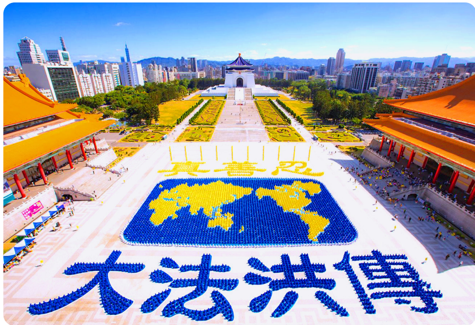
▲ 2019年11月16日，台湾约6500名法轮功学员排出“真善忍”和“大法洪传”大字。

100多天出院后，有法轮功学员到我家来和我一起学法，炼功抬不起手，丈夫和儿媳帮着我抬起来，我彻底清醒了过来。在家6个月后，我到