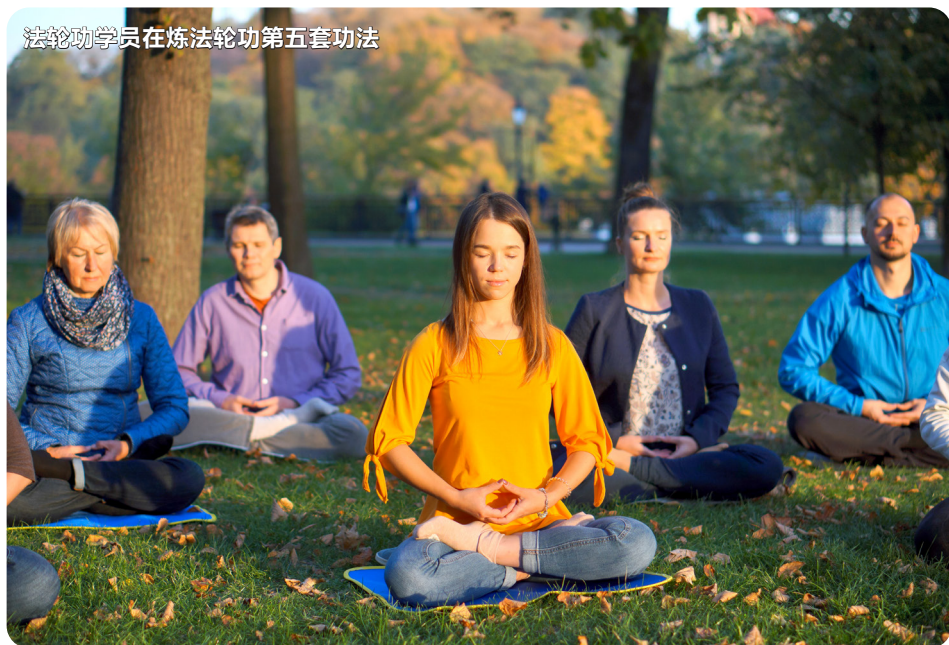
法轮功学员在炼法轮功第五套功法

当人类从喧嚣繁华回归到宁静！ 一本好书！一首悠扬的音乐…… 安静片刻的打坐…… 身心良药…… 免疫力也跟着提升