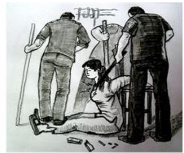
中共酷刑演示：电击、蹂躏