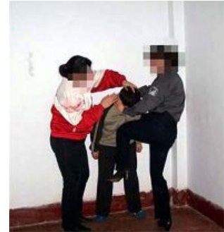
中共酷刑演示： 暴打