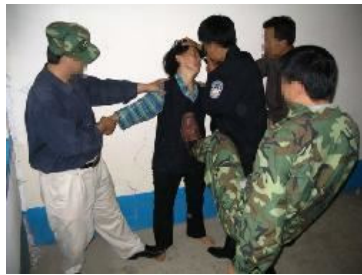
中共酷刑演示： 拳打脚踢