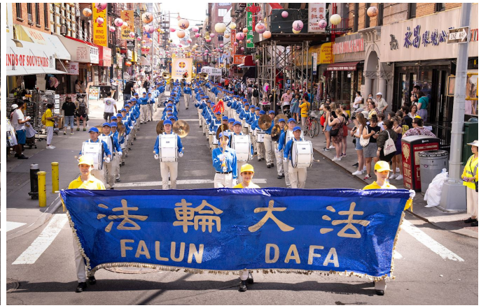
▲2023年7月15日，约两千名中西族裔法轮功学员，在纽约曼哈顿华埠中心举行游行，纪念反迫害24周年。