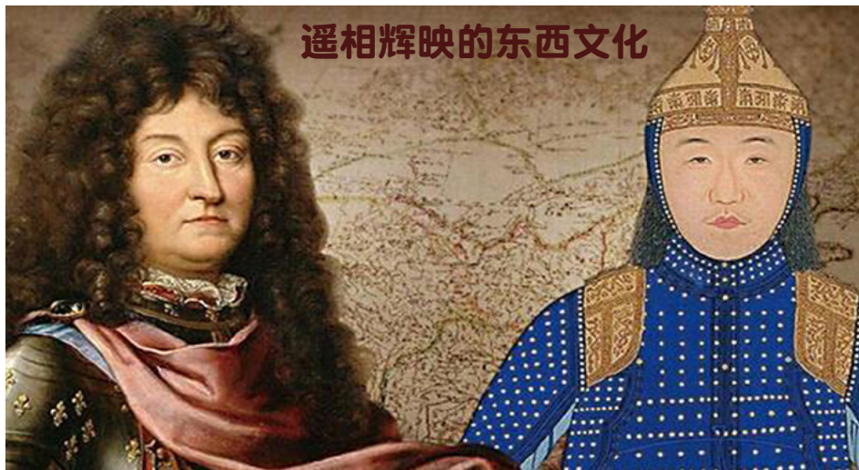
遥相辉映的东西文化