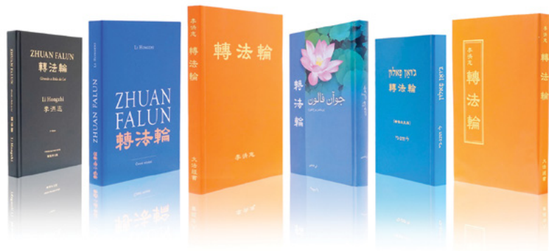
《转法轮》出版近30年，被翻译成40多种语言在世界各地发行。一本奇书改变上亿人。

六年级下半年刚开学，老师把我的座位由原来的第四排安排到最后一排（班里一共86人），而且同桌是一个不讲卫生、身带狐臭味的男生，班里的同学都不愿和他同桌；很多同学打过他，扔他的东西。开始，我很同情他是留守儿童，父母常年在外打工，跟70多岁的奶奶一起生活。一天，同桌的凳子坏了，正好前排有个