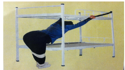
中共酷刑演示：（上排左起）抽打、电棍电击、竹签扎手指、上大吊

书”，不写就体罚、抽打，半夜才让睡觉。即使睡觉，也是睡在光板床上，甚至连衣裳都不让盖。不仅如此，每个月还逼她写“思想汇报”、逼说假话、干奴工活，她们还找茬挑毛病、说打就打、说骂就骂。