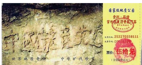
▶ 2002年6月，在贵州省平塘县掌布乡发现了距今2.7亿年的藏字石，惊现“中国共产党亡”六个大字。图为藏字石风景区门票。◇

一旦你被中共定为“搞政治”，人们就会发生一种“良知错位”——尽管中共残害无辜，人们反而去责备受害者，好象“搞政治”比中共杀人还可怕。