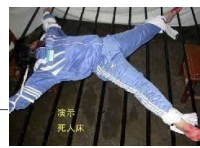
▲酷刑示意图：死人床