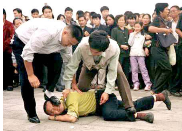
▲ 和平请愿的学员，被恶警在天安门广场公然践踏。

毛泽东时期，制造了许多连年不断的“运动”——土改、三反、五反、工商改造、大跃进（大饥荒）、文革等；邓小平时期的“六四屠城”、江泽民时期的镇压法轮功。中共在和平时期大开杀戒，杀地主、杀资本家、杀知识分子、杀学生、杀法轮功等平民百姓，总共屠杀了（不含因计划生育政策，人工流产等造成的死亡人数）8