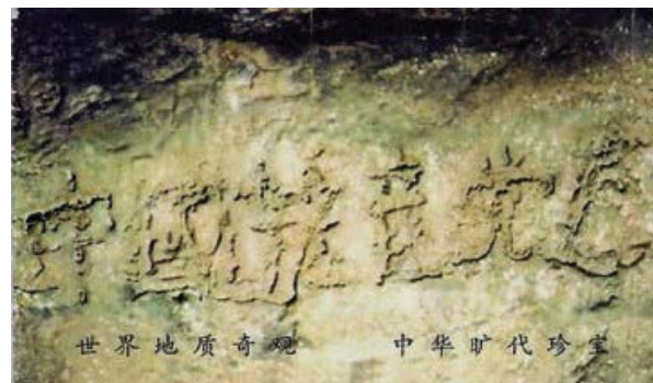
▲ 贵州省平塘县发现的“藏字石”。

一个拜洋人为祖宗的境外势力恶党，会对炎黄子孙有感情吗？一个以无神论、进化论、唯物论为世界观的政党，会对神的子民、中华儿女有感情吗？一个与天斗、与地斗、与人斗的中共，10年浩劫毁灭中华5千年文明，血腥暴政害死8千万中华儿