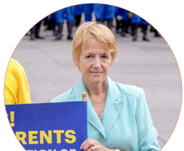
弗朗索瓦丝·霍斯塔利埃女士

今年8月26日，来自超过30个欧洲国家的部分法轮功学员汇聚在法国巴黎，在共和广场举行集会，呼吁制止迫害。多位政要到场支持。