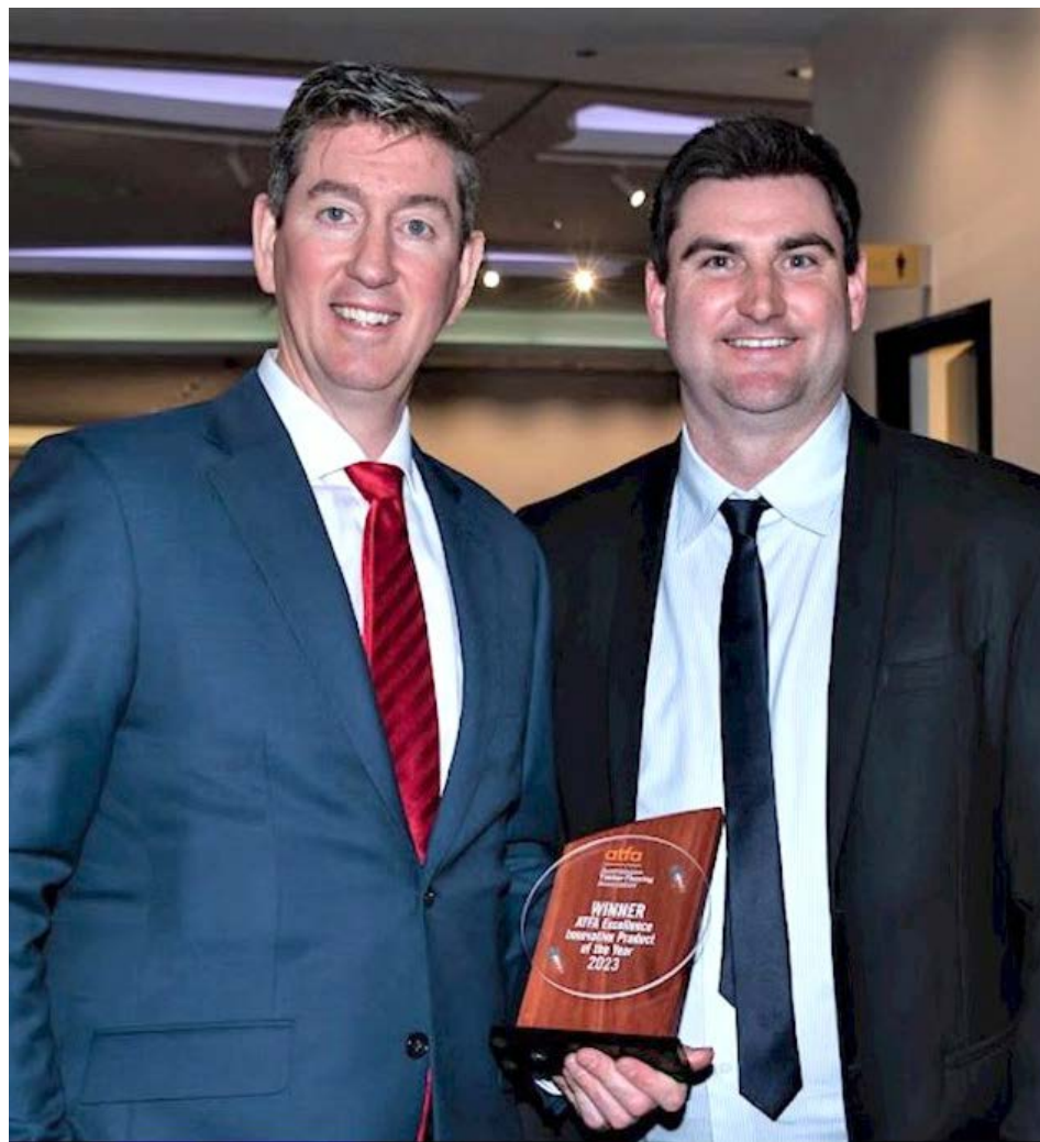
▲ 哈奇森的公司荣获 ATFA 年度卓越创新产品奖。

荣获 ATFA 年度卓越创新产品奖。哈奇森没想到，自己的正义之举使得公司免于破产。善良正直的选择，最终