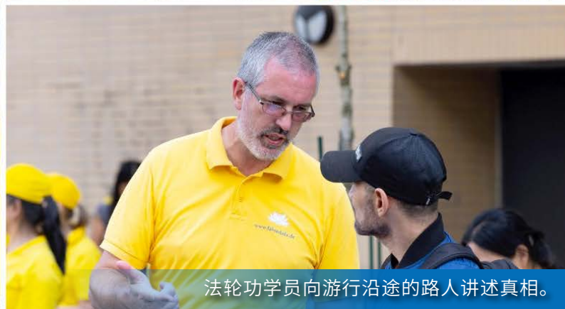
法轮功学员向游行沿途的路人讲述真相。