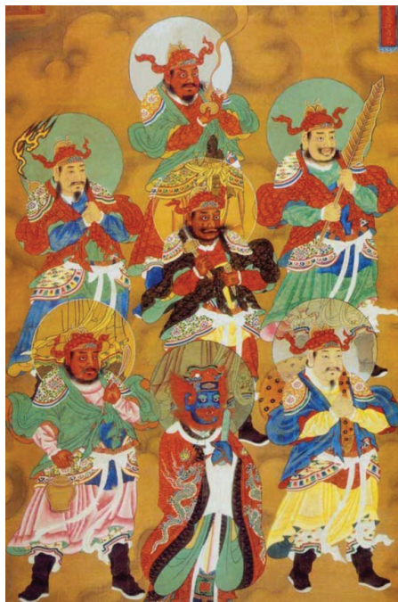
■ 明代万历水陆画（局部），瘟神。

中国人家家都是围绕着孩子转，孩子遭罪，才会让大人心痛，让大人反思。我们或许可以从《圣经》〈出埃及记〉记载的埃及十灾中的“长子灾”，得到一点启发。