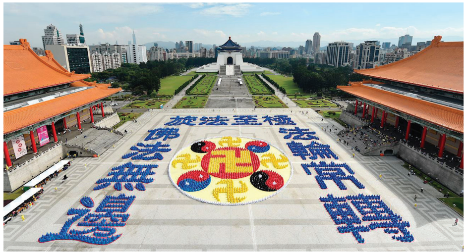
■ 二零二三年十二月九日，约五千多名法轮功学员在台北自由广场排字。

年，一百多个国家、上亿人学炼，台湾是中国大陆以外学炼法轮功华人最多的地方，这让一年一度的排字盛会别具意义。在台湾，人民有信仰、言论自由，很多人修炼法轮大法身心受益。然而这么好的全世界都欢迎的功法，在对岸的中国大陆，却遭到中共的残酷迫害，甚至修炼人被活摘器官。对比如此强烈。所以活动现场有真相图片展示，让世人关注法轮功学员被迫害的事实。