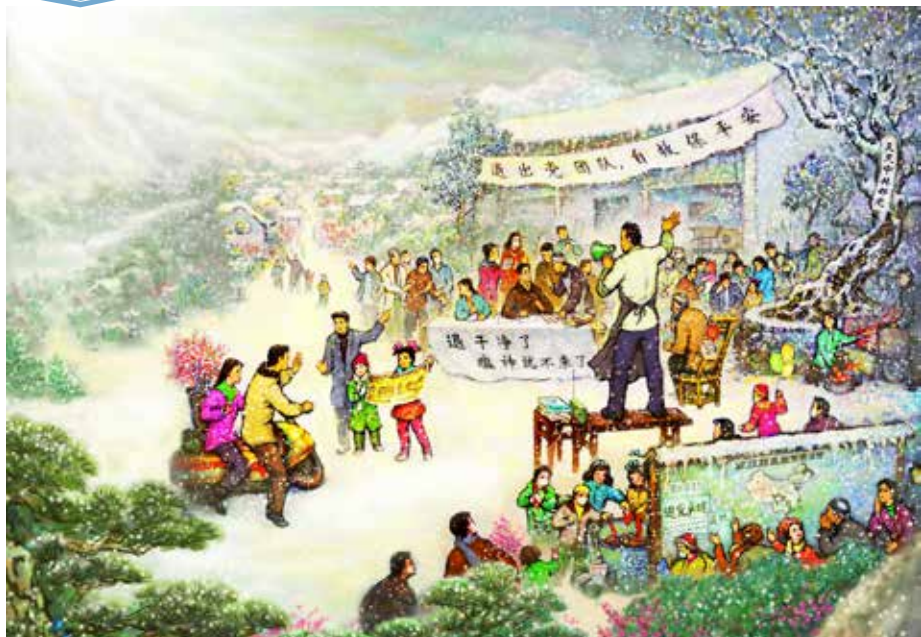
■ 绘画：《村长带领全村三退自救》。