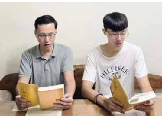
■ 父子俩一起学《转法轮》。