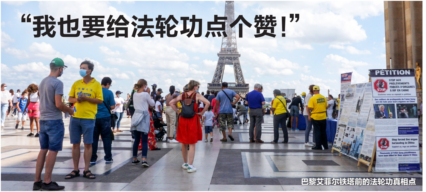
巴黎艾菲尔铁塔前的法轮功真相点

2024年10月，巴黎的各个景点、超市、商场、购物中心等场所，各国的游客像潮水般地涌进。我与几位法轮功学员穿梭在人群中，向中国游客讲真相，劝“三退”。