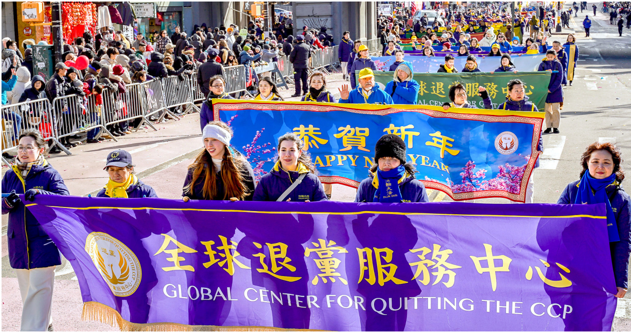
◀ 2025年2月1日，乙巳年大年初四，纽约法拉盛华人新年大游行，道路两边人山人海。法轮功的游行队伍在大游行中显得格外耀眼。