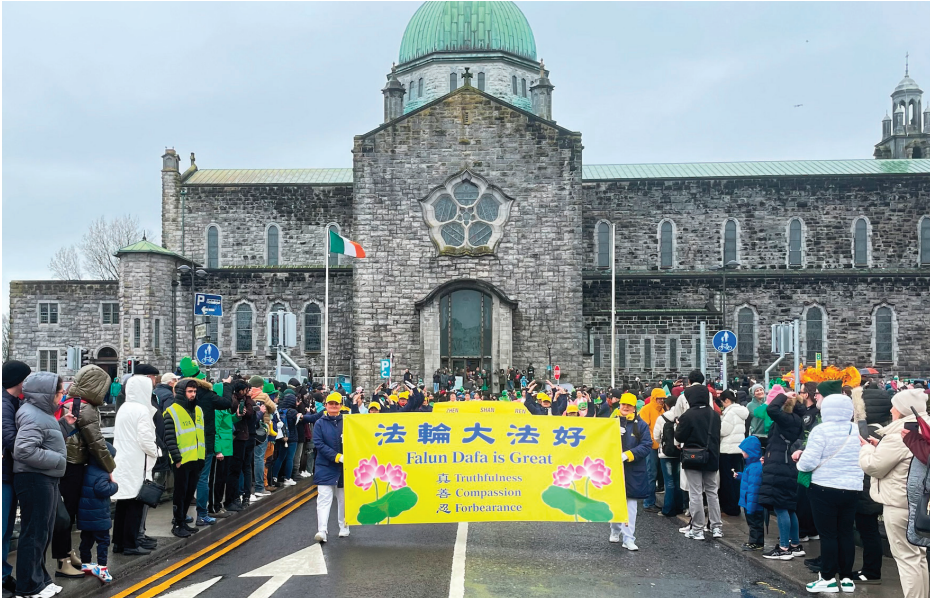
▲ 3月17日, 爱尔兰法轮大法学会参加高威古城国庆节大游行。

【明慧网】爱尔兰一年一度的盛事——圣帕特里克节大游行, 于2026年3月17日在高威古城如期举行。作为传统天主教国家, 圣帕特里克节同时也是爱尔兰的国庆日, 会吸引世界各地游客前来感受节日氛围。