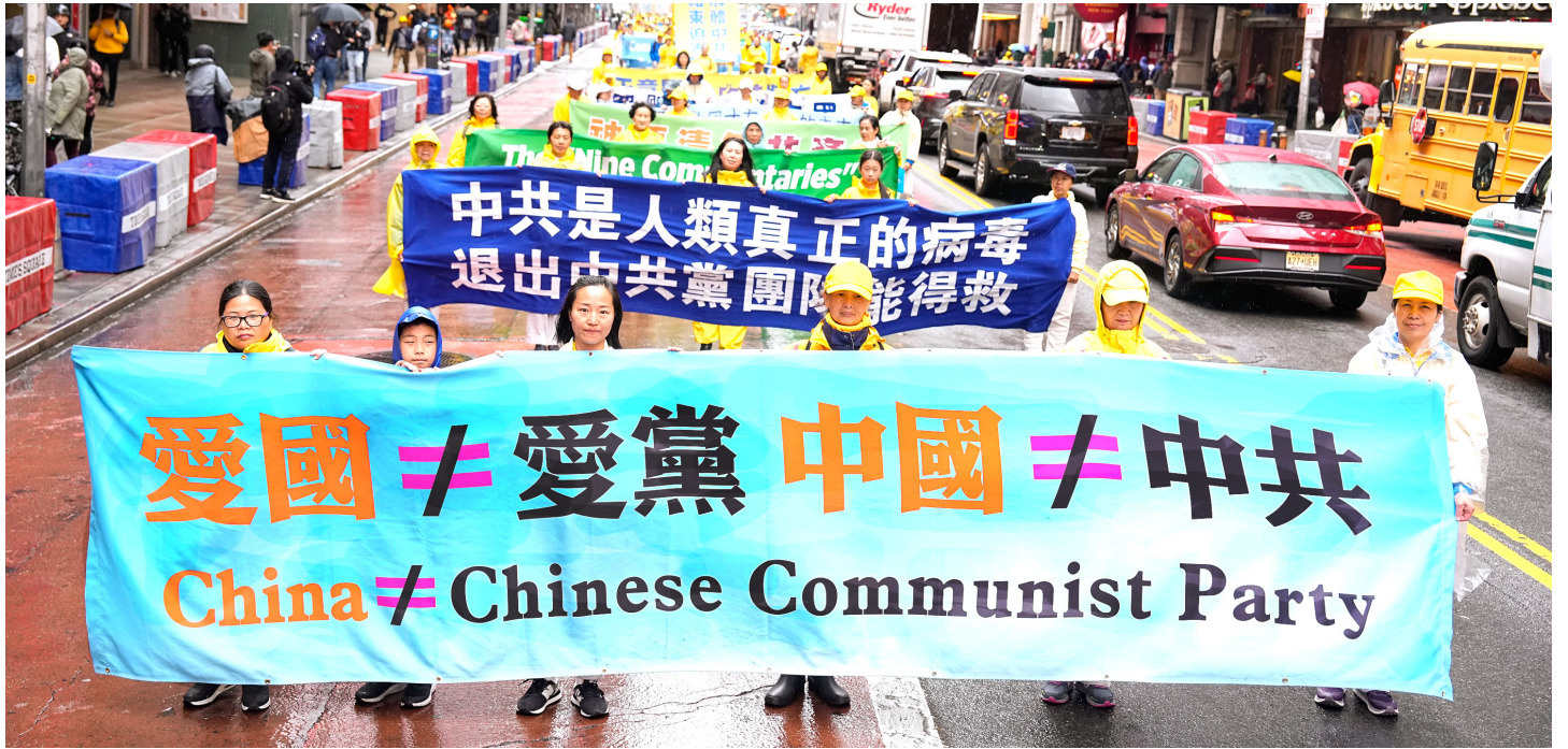
▲ 2024年5月10日，美国纽约法轮功学员在曼哈顿举行大游行。