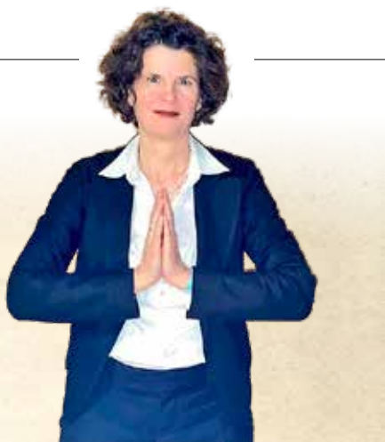
▲ 德国法轮功学员希尔克女士。