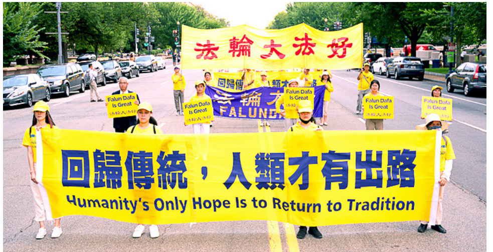
▲ 2021년 7월 16일, 파룬궁수련생들이 미국 워싱턴 DC에서 성대한 집회를 거행해 박해 저지를 호소하고, 세인에게 다시는 중공 무신론 기편을 당하지 말고 전통에 회귀하여 ‘진선인(真善忍)’가치를 존중하여야 인류에게 희망이 있다고 알렸다.

그는 정신차리고 아주 통쾌하게 친척에게 자신과 아이를 도와 중공조직에서 탈퇴해 주기를 부탁했다. 후에 남자아이는 순조롭게 대학에 록취되었고, 학교에 보도하기전에 그는 아이의 당안주머니에서 “예비당원” 자료를 꺼내 철저히 소각했다. 그때로부터 그의 허리디스크 증상이 사라졌다.