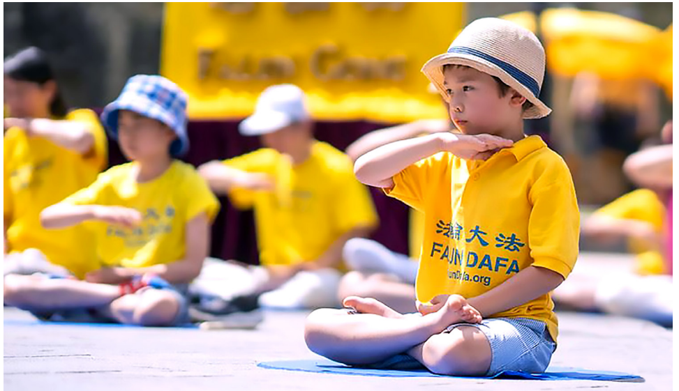
▲ 가부좌는 아이더러 신심의 건강과 내심의 평화를 찾게한다.

아이들의 행복과 미래는 강제적인 주입식 교육에 들어있는 것이 아니라 그들의 ‘진선인(真善忍)’을 갖춘 내심에 있다.