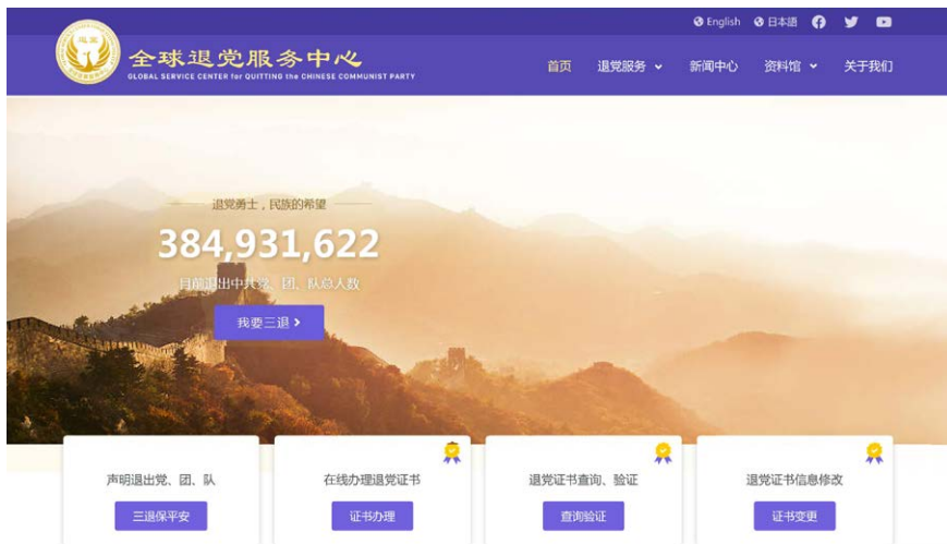
图 4.2 截至 2021 年 10 月，在全球退党服务中心声明“三退”的人数已超过 3.8 亿人。