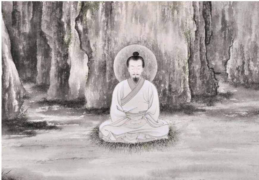
图 5.1 绘画：《修道人》。

这才想起了道人，想起了他说的话，虽然将信将疑，但也顾不得这么多了，试试吧。晚上奶奶拿了一把香在院子里点上后，叫着道人的名字快来。