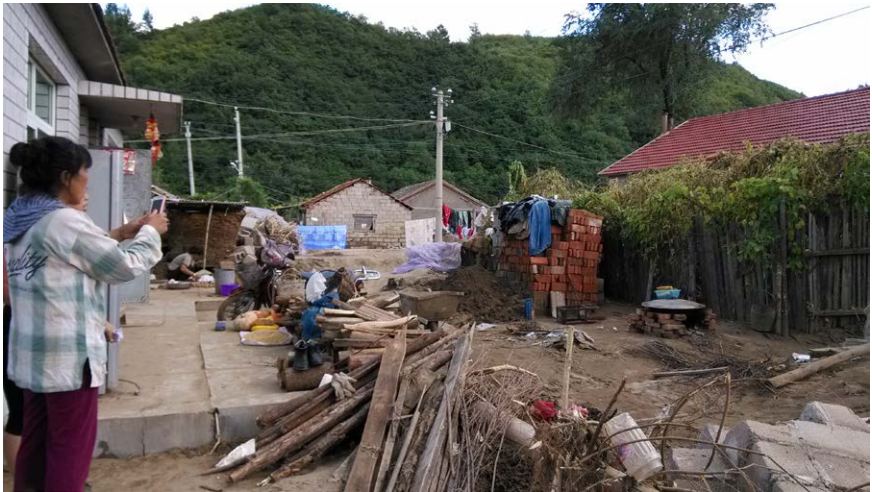
图6.2 这几家为营救法轮功学员签过名，大洪水中家里进水很少，没有损失，洪水过后为无家可归的乡亲提供食宿。

1、6岁孩子急中生智。 住在管厂附近的一家三口人，在大洪水来时都上到房顶上了，这时院子里的水已经涨到房子圈梁那么高了，眼看水要淹过房子。紧急关头，6岁女孩急中生智，对妈妈说：