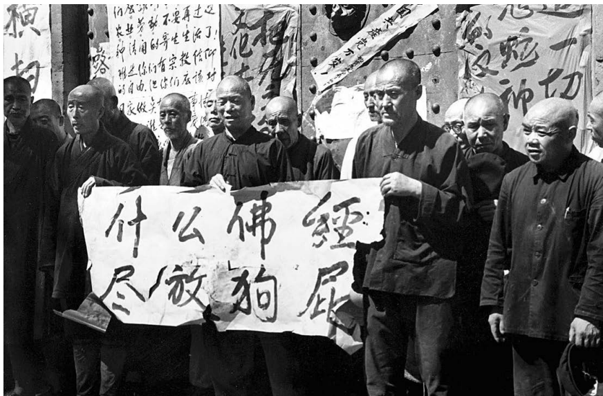
图 3.5 1966年8月，红卫兵捣毁了北方名寺哈尔滨极乐寺，把和尚们揪到山门外批斗，逼迫他们手里扯着“什么佛经 尽放狗屁”的标语自辱门楣，以示与封建迷信彻底决裂。

革究竟死了多少人？叶剑英在1978年12月13日中央工作会议闭幕式上的讲话称：“中央经过两年零七个月的全面调查，文化大革命死了2000万人，受政治迫害人数超过1亿人，占全国人口的九分之一，浪费了8000亿人民币。”