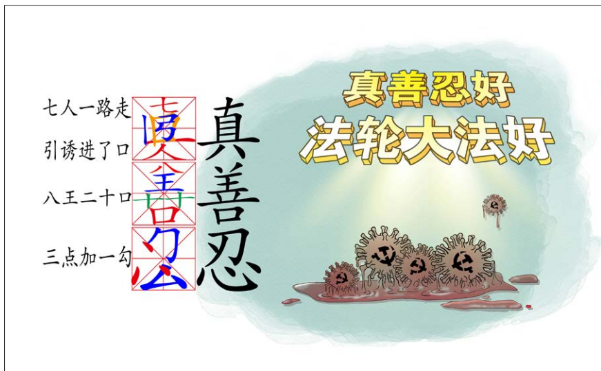
图 5.3 拆字图示

《刘伯温碑记》曾提到“十愁难过猪鼠年”，但是因为大法救人还在给人机会，所以时间得以延续。当法轮功学员告诉您诚念“法轮大法好，真善忍好”时，请一定牢记在心。在您动真心的一念之间，一切都会向好的方向转变！