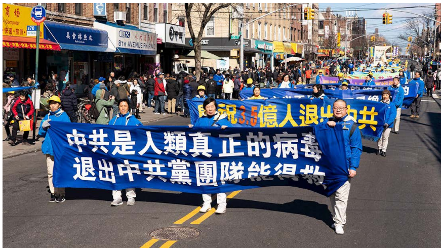
图 7.3 2020 年 3 月，法轮功学员在纽约游行，向人们传递真相。

法轮大法就是末世中救人的佛法，无数事例证明，诚念“法轮大法好，真善忍好”，就是最好的避难与自救良方；认同大法好，人心向善，是给自己的生命上了最好的保险。而中共宣扬的无神论只是骗人的伎俩，人定不能胜天！人应该顺天而行，抛弃逆天叛道的共产邪灵，不再是它的一分子，中共遭受天惩时就与您无关，所以说“三退”就能保平安。如今已有超过3.8亿人“三退”，为自己选择了美好的未来。