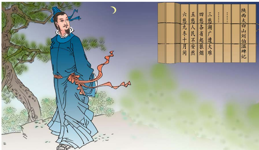
图 5.2 插图:《刘伯温》。