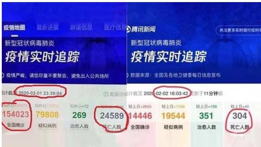
图 3.7 2020 年 2 月 1 日，腾讯新闻公布武汉肺炎死亡人数达 24589，第 2 天随即改为 304。