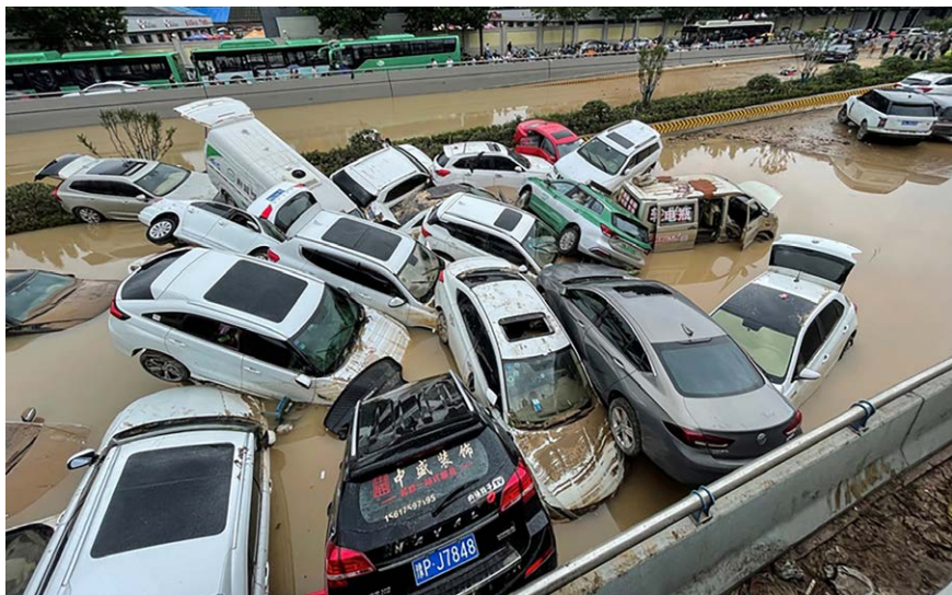
图 1.1 2021 年 7 月 20 日，郑州洪灾中，京广隧道口被洪水冲击在一起的汽车。