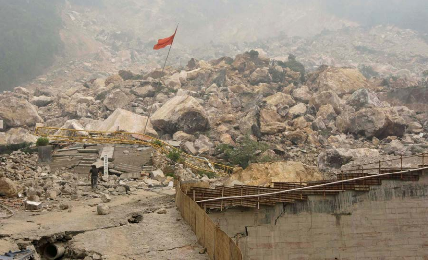
图 6.3 汶川大地震中被夷为平地的北川中学