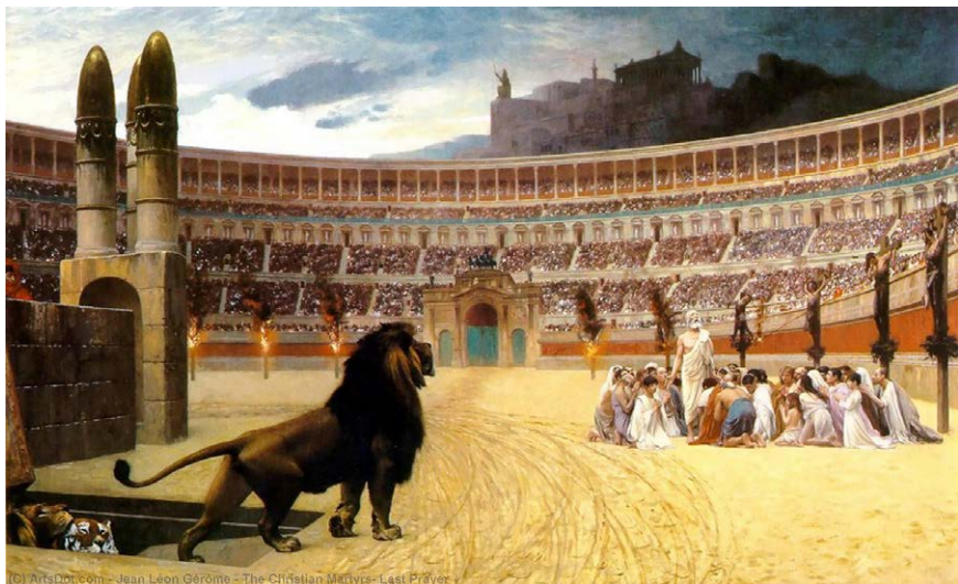
图1.2 《基督殉道者最后的祈祷》描述了罗马迫害基督徒的情景：竞技场上，左边是遭受火刑的基督徒，右边是钉死在十字架上的基督徒，中间是即将被猛兽撕碎的基督徒。

而造下罪业？这些罪业吕都得去承担。他犯下天大的罪过，以至不但自己偿还，妻儿还要受牵连。