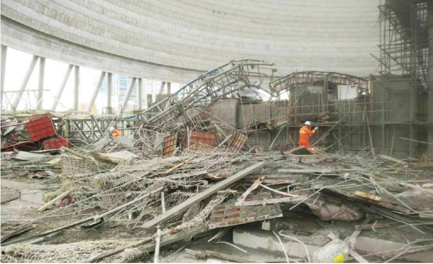
图6.4 2016年11月24日，江西丰城发电厂冷却塔施工平台倒塌。