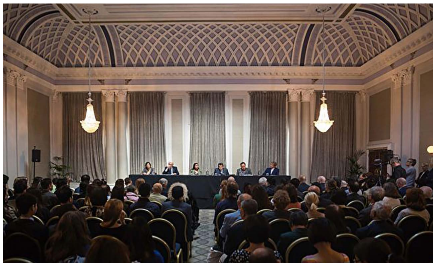
图 3.3 2019年6月17日，“人民法庭”在伦敦宣判中共政府活摘良心犯器官的行为仍然存在，法轮功学员是器官供应的最主要来源。

一桩桩血泪交织的酷刑事件中，幕后操控、纵容、默许、包庇和奖励的中共是这些罪行的最大根源。