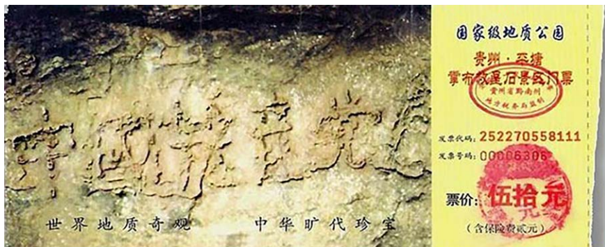
图 4.1 贵州省平塘县掌布风景区门票

经专家考证，巨石距今2.7亿年，500年前从高崖上落下，断成两块，字在右边那块巨石上，清晰可辨。经鉴定，这些字都是天然形成的，没有任何人为加工的痕迹。当时，100多家媒体，包括新华社、中央台都有过报道，网上也能搜索到相关照片。当然，这些媒体都不敢提最后那个“亡”字，但从照片上可以看出来。