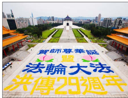
图2.3 1999年，成都法轮功学员在晨炼。图2.4 2021年5月1日，5200多名法轮功学员在台湾台北中正纪念堂前自由广场排字，庆祝法轮大法弘传世界29周年。