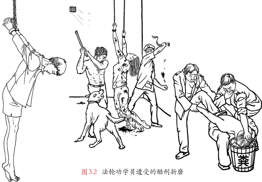
图 3.2 法轮功学员遭受的酷刑折磨