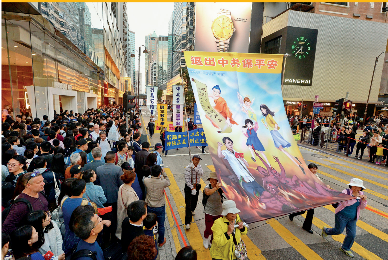
■2019年之前，香港法輪功學員每年舉行多次反迫害大遊行，向世界揭露中共迫害法輪功的罪行，呼籲人們退出中共黨、團、隊組織，為自己選擇光明的未來。圖為2017年1月的反迫害大遊行。

章上有層黃的，我父親當成金子了。我和妻子聽了都笑了，放心了。我把那個邪黨紀念章砸毀了。這一次住院，病情較輕，挺平穩，很快就出院了。這樣整個2018年我父親住了五次醫院。