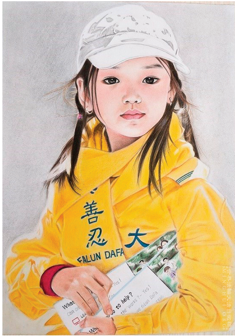
■繪畫作品：《播撒希望》。作者：如初。畫中的小女孩是散發真相傳單的大法小弟子。

我說：「你家所長剛上任，想搞出點成績，好快點提升，就把我孩子抓走了，說他要進京，擾亂社會治安。我孩子才十六歲啊，正讀中學呢！他進甚麼京呢？我們修煉法輪功的，都按真、善、忍做好人，為別人著想，不做任何壞事，這也成了罪過嗎？我給你一份傳單，你看看，看明白了，你