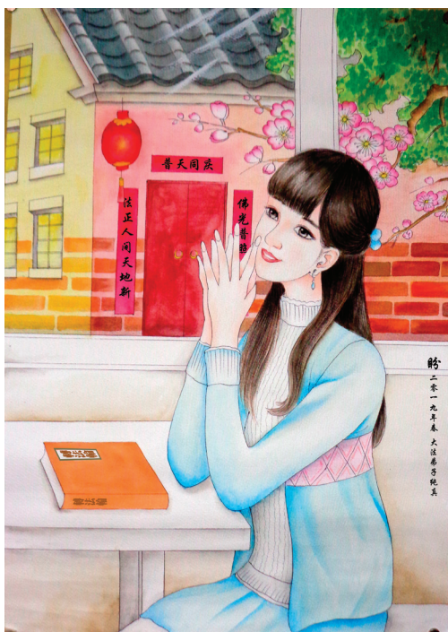
■中國大法弟子繪畫作品：《盼》。