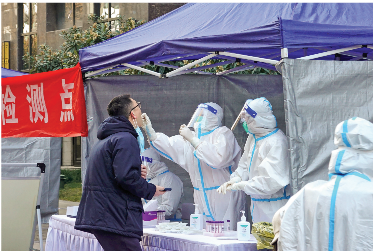
■去年十二月二十九日，西安一民衆接受核酸檢測。

我媽突然全身發冷打顫，並伴有嘔吐，緊接著全身疼痛出冷汗，胸悶氣短，弟弟趕緊把她送進醫院，經過詳細的檢查，最終得出的結論是肺癌晚期，癌細胞已經轉移了，加上年齡大，無法診治，只能打點止痛藥和消炎藥。