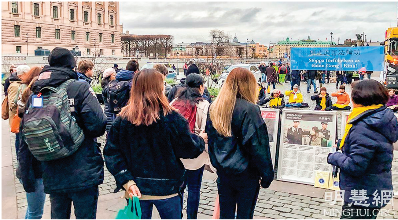
■法輪功學員在瑞典斯德哥爾摩市中心國會大廈旁的錢幣廣場舉辦講真相活動，吸引瑞典民衆駐足觀看展板、與學員交談，了解法輪功真相。

接著其中一位警察還向學員詢問了很多關於法輪功的信息。他對學員說：「我們的工作每天都要去面對和處理各種麻煩事，身心疲憊，我很想嘗試一下這個功。」臨走時他取了一張介紹大法真相的傳單，