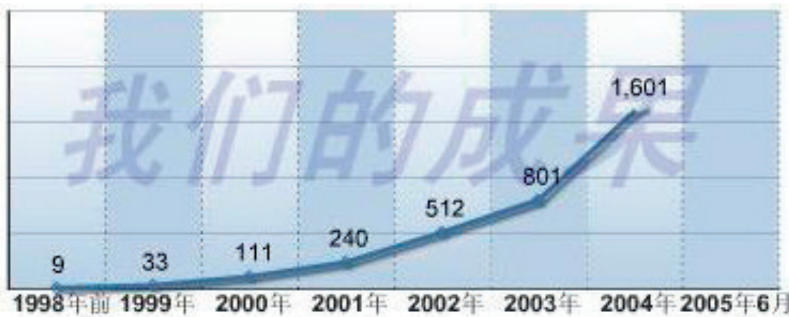
左圖：天津東方器官移植中心網站首頁上顯示的「肝移植成果圖」

自從 2006 年中共活摘法輪功學員器官罪行曝光之後，中共為了應付巨大的國際壓力，從原來堅決否認死刑犯為器官移植來源，改口為死刑犯為主要器官移植來源。即使這樣，死刑犯的器官數量能滿足那幾年器官移植爆棚的亂象嗎？