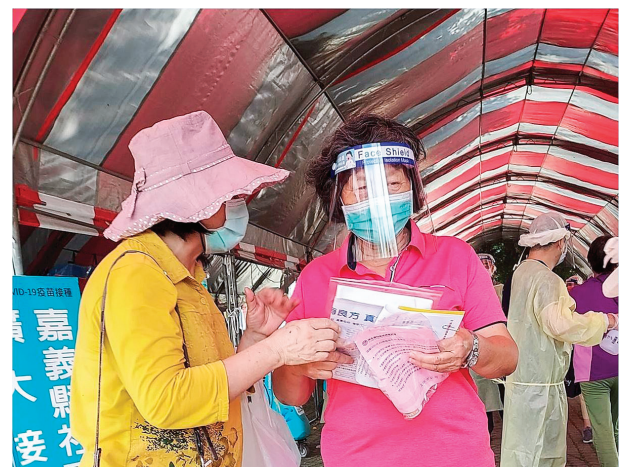
■台灣嘉義法輪功學員在疫苗施打站發特刊，告訴民衆抗疫良方及法輪功真相。

學員還說，雖然航班取消了，也未必就是壞事，這樣安排你來三退保平安的。小伙子聽了後笑了。