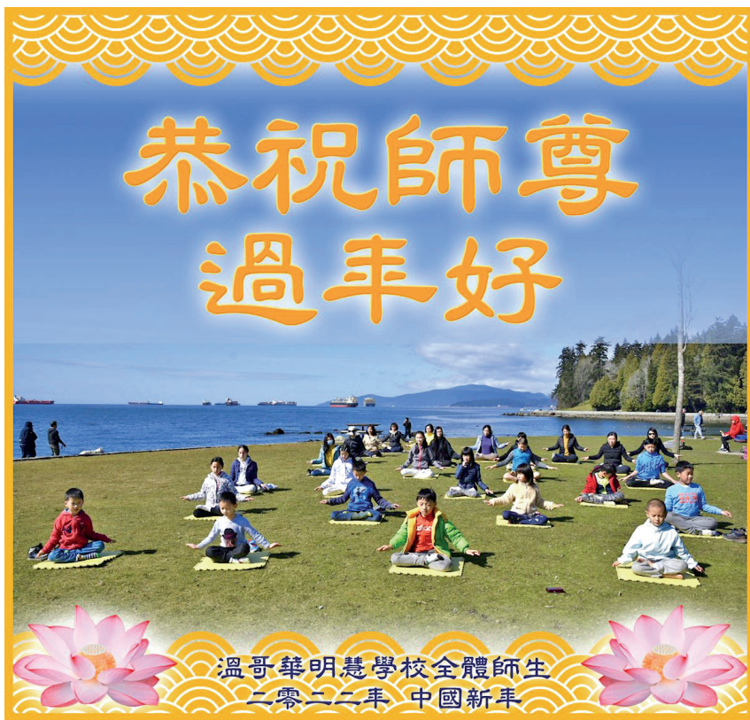
給師父的賀卡展示明慧小弟子的一次煉功場面。

後來有一次，這個孩子在學校摔了一跤，挺嚴重的，瑞瑞馬上把這個孩子送到醫務室去包紮。