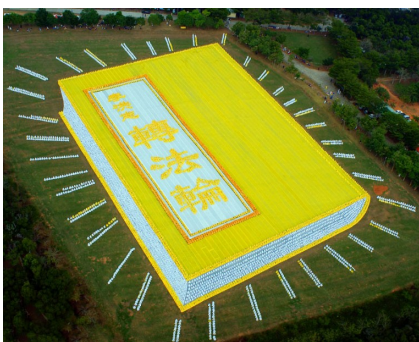
▲海外数千名法轮功学员排字，组成巨型书籍——《转法轮》。

《转法轮》公开发行之后，迅速在中国各地传播开来，同时弘扬到一百多个国家与地区，使全世界超过 1 亿人身心受益。◇