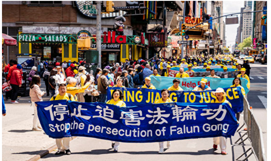
2019 年 5 月 16 日，世界各地部分法轮功修炼者，聚集在美国纽约曼哈顿，游行呼吁停止迫害法轮功。