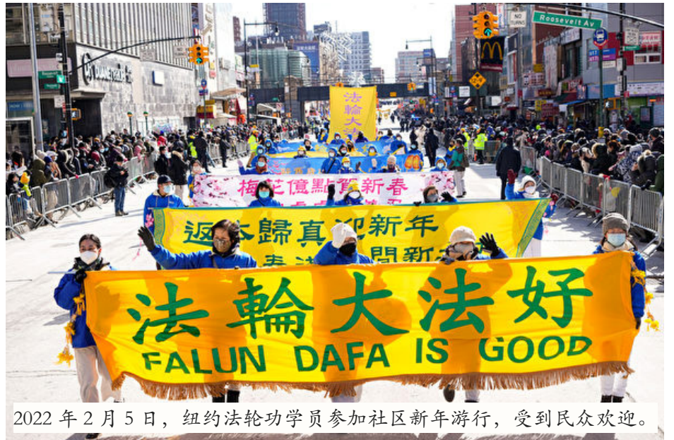
2022年2月5日，纽约法轮功学员参加社区新年游行，受到民众欢迎。

当上天要灭它时，当然会连带它的成员——党员、团员、队员。所以退出中共组织，是表明自己不与邪恶为伍，是避免天灭中共时受到连累。这样说来，劝您“三退”的人，那是真心为您的平安着想，真心为您好。◇