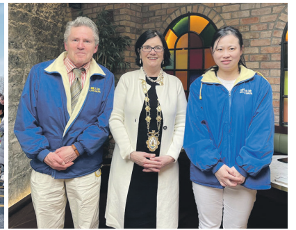
▲ 法轮功学员应邀参加爱尔兰国庆游行；右图为高威市长莱特·康诺利（中）和法轮功学员合影留念。

法轮功队伍经过主席台时，主持人特别介绍说：“法轮大法是中国传统修炼功法，以真善忍为准则，自1992年传出，全世界100多个国家和地区有1亿多人修炼。法轮大法好！”