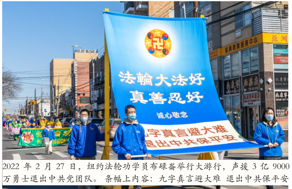
2022年2月27日,纽约法轮功学员布碌崙举行大游行,声援3亿9000万勇士退出中共党团队。条幅上内容:九字真言避大难 退出中共保平安

▲2021年7月16日,近两千名法轮功学员在美国首都华盛顿DC举行声势浩大的反迫害游行。呼吁国际社会:停止迫害法轮功,法办迫害法轮功元凶江泽民。