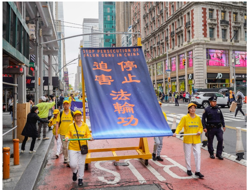
图：2022年5月13日，是第二十三届世界法轮大法日，也是法轮大法创始人李洪志先生华诞，同时是法轮大法洪传世界30周年纪念日。来自大纽约地区各族裔的部分法轮功学员约4千人在曼哈顿最繁华街区举行盛大游行，庆祝这个伟大的日子，并表达对慈悲伟大的师尊的感恩。第一方阵“法轮大法好”；第二方阵“停止迫害法轮功”；第三方阵“庆祝3.9亿三退大潮”。