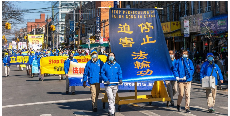
▲2022年2月27日，纽约法轮功学员布碌仑主街8大道举行游行，声援3亿9000万勇士退出中共党团队，呼吁停止迫害法轮

后可怕的副作用没有出现在她身上，食欲比以前还好，体重增加了二十斤，气色越来越好，完全不像个癌症病人。同病房的人化疗后都非常痛苦，食水难进，她却没有什么感觉，这本身就是一个奇迹。