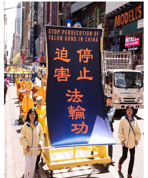
2018 年 5 月 11 日约两千名法轮功学员在美国纽约举行盛大游行。