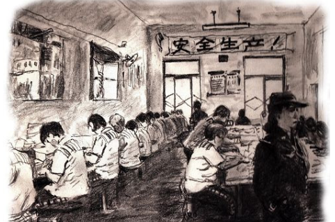
▲酷刑示意图：拖着熬鹰、约束衣、强迫奴工。