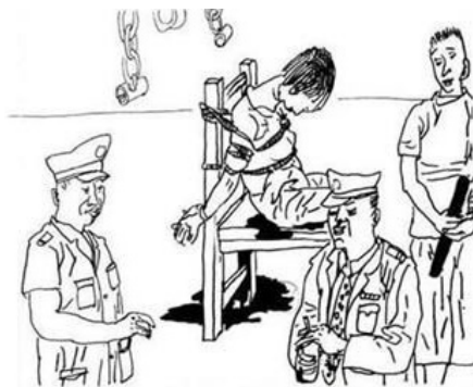
▲酷刑示意图：捆绑在椅子上、关铁笼子