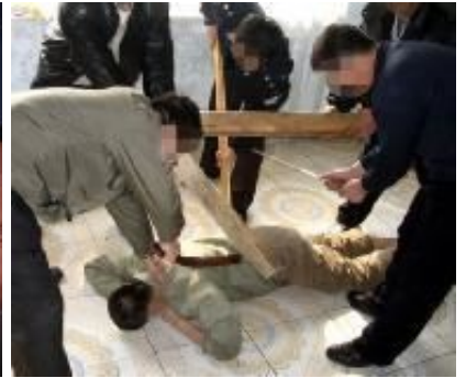
▲酷刑演示图：绑死人床、电棍电击、毒打。