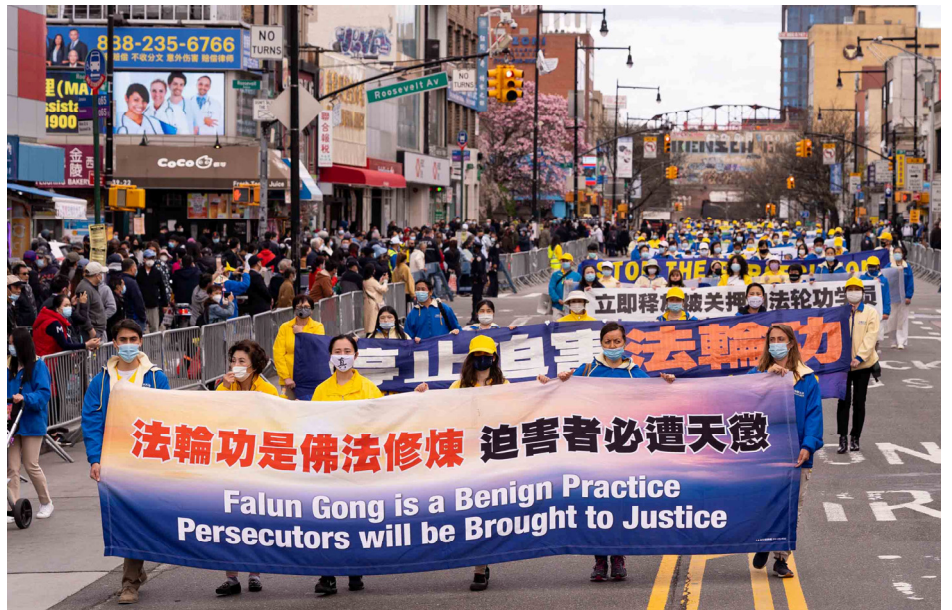
2021年4月18日，上千名大纽约地区各族裔法轮功学员，在纽约华人社区法拉盛举行反迫害游行。向世人呈现“法轮大法好”、“停止迫害法轮功”、“法轮功是佛法修炼 迫害者必遭天惩”等一百多真相条幅。

按国际法，迫害法轮功触犯的是反人类罪、群体灭绝罪和酷刑罪。2021年，三十八个国家的法轮功学员将一份中国大陆“610”人员的名单递交各国政府。要求依法对恶人及其家属禁止入境、甚至冻结资产，名单包括收集不完整的全国各级“610”办公室的9300人。该名单上的四川省成都市前“610”办公室主任余辉，已于2021年5月12日，由美国国务卿安东尼·布林肯宣布进行制裁。◇