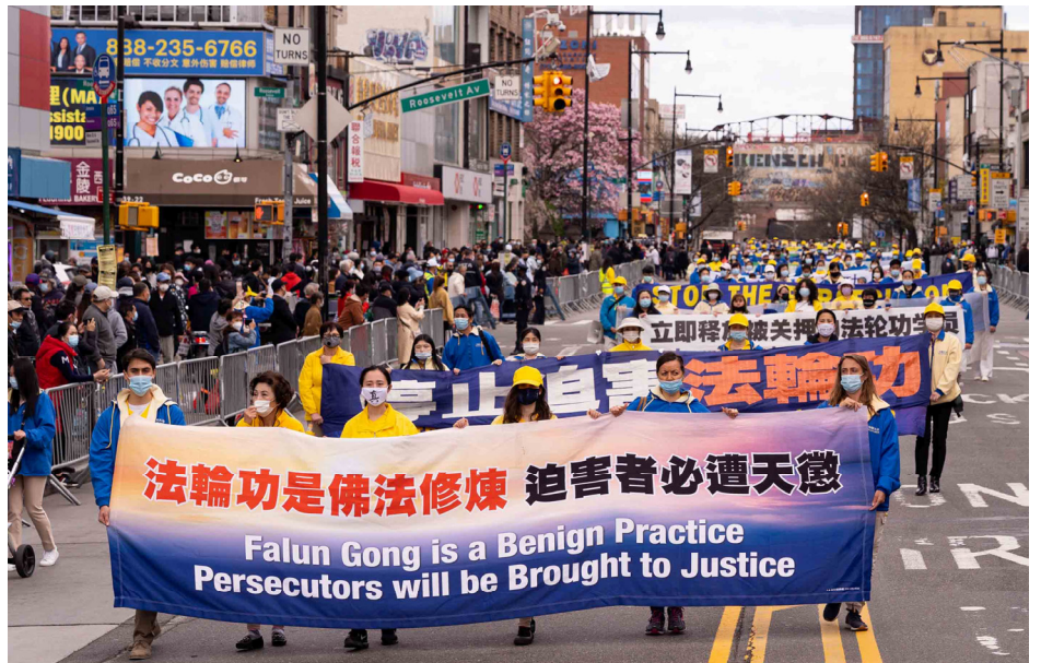
2021年4月18日，上千名大纽约地区各族裔法轮功学员，在纽约华人社区法拉盛举行反迫害游行。向世人呈现“法轮大法好”、“停止迫害法轮功”、“法轮功是佛法修炼 迫害者必遭天惩”等一百多真相条幅。

按国际法，迫害法轮功触犯的是反人类罪、群体灭绝罪和酷刑罪。2021年，三十八个国家的法轮功学员将一份中国大陆“610”人员的名单递交各国政府。要求依法对恶人及其家属禁止入境、甚至冻结资产，名单包括收集不完整的全国各级“610”办公室的9300人。该名单上的四川省成都市前“610”办公室主任余辉，已于2021年5月12日，由美国国务卿安东尼·布林肯宣布进行制裁。◇