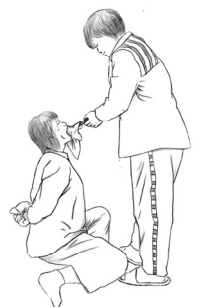
▲ 酷刑示意图：用鞋刷捣抹布堵法轮功学员嘴。

图：双腿强行一字劈开。犯人强行将法轮功学员的双腿一字劈开。两个塑料板凳不断地向身后挪，折磨得法轮功学员疼痛惨叫。