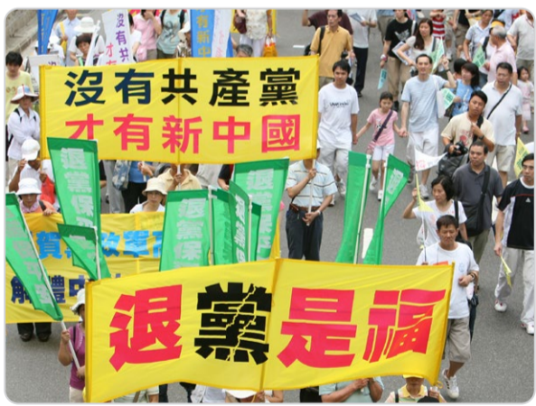
◎退党是福！庆祝“三退”的游行队伍经过香港繁华街道时，吸引许多市民与中外游客观看。