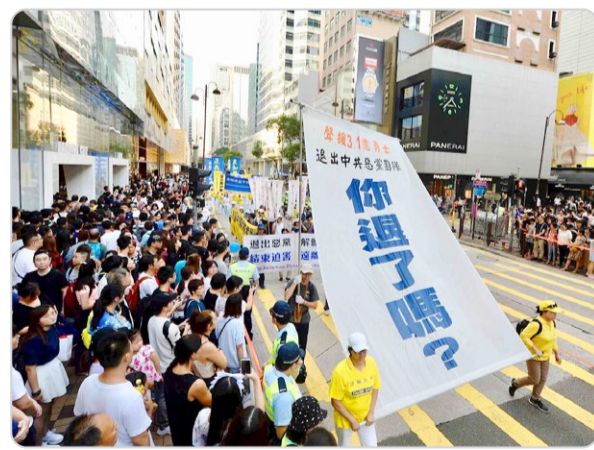
◎盛大游行中“你退了吗？”的巨幅标语，不仅震撼香港中外游客，也已成为华人中的流行语。

疫情过后，城市解封，全家族人聚会。亲友们感叹地说：“疫情如此严重，我们家族中却没有一个‘小阳人’。看来，‘三退’真的能保平安啊！”