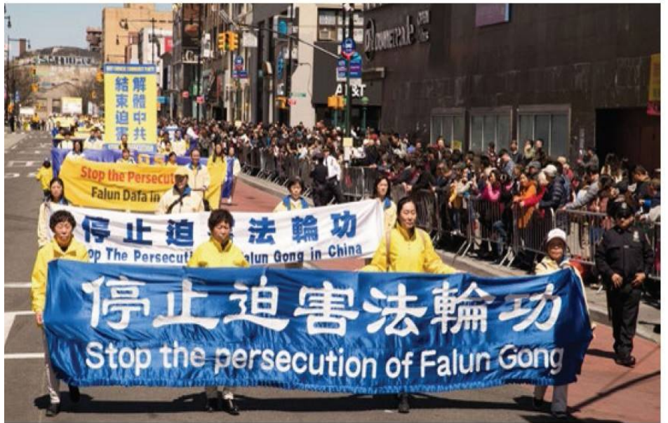
2018年美国纽约法拉盛游行，呼吁停止迫害法轮功。

▲1992年和1993年的北京东方健康博览会上，法轮功被誉为“明星功派”，获得“边缘科学进步奖”，李洪志先生荣获“受群众欢迎气功师”称号。