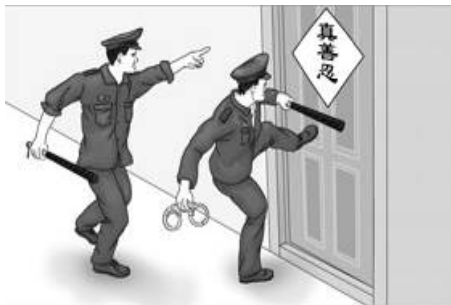
▲漫画：中共警察闯入民宅绑架法轮功学员