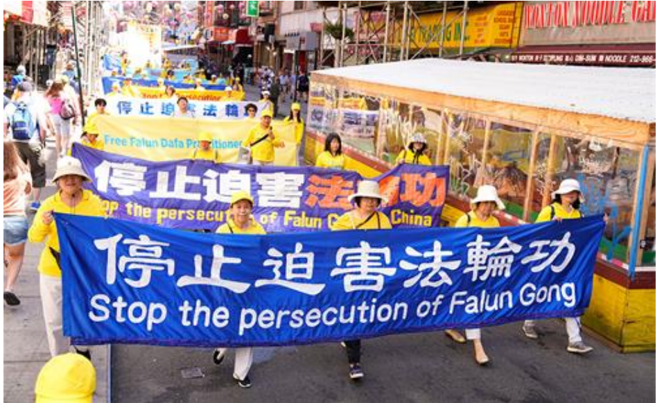
2022年7月10日，法轮功学员在美国纽约市唐人街举办“7.20”反迫害23周年大游行。